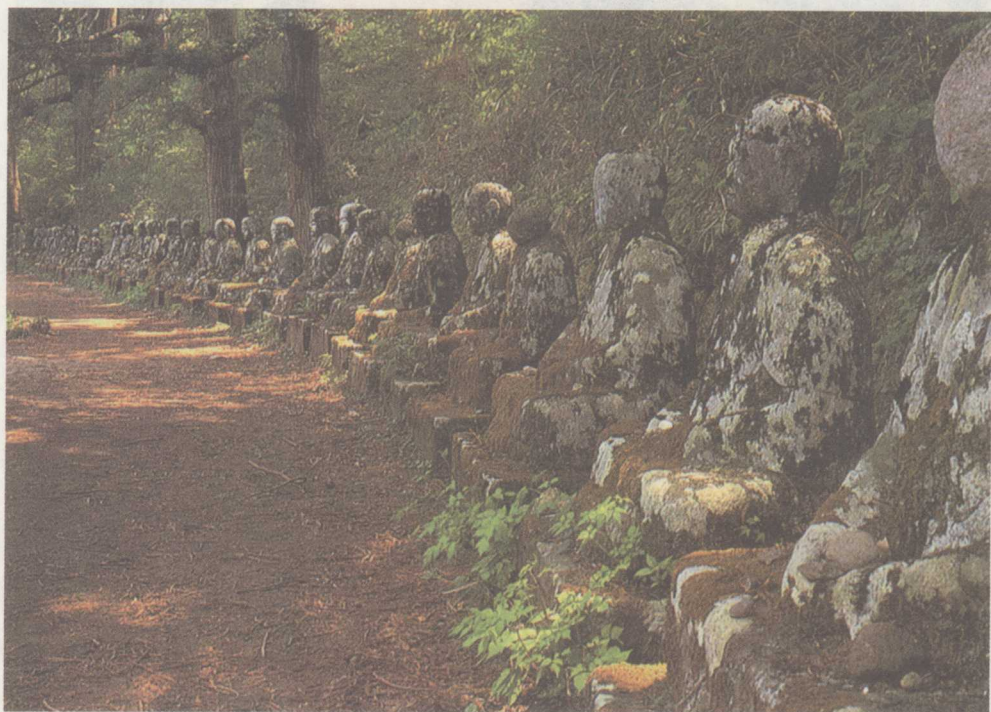
幕府将军的武士石像