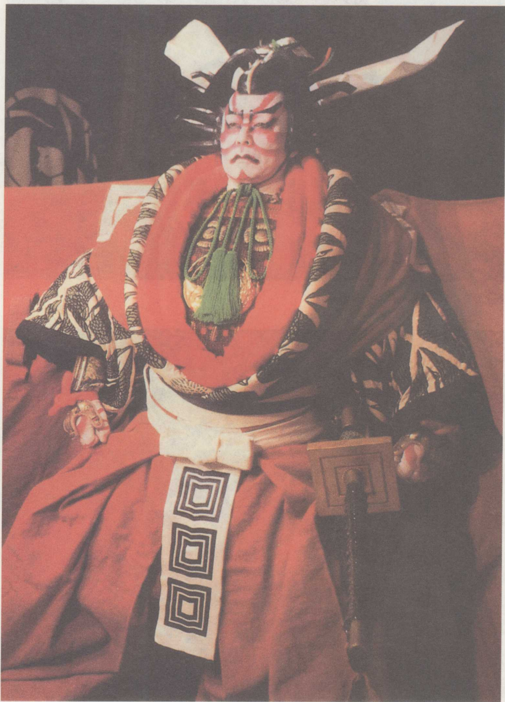
18世纪歌舞伎男演员的典型形象