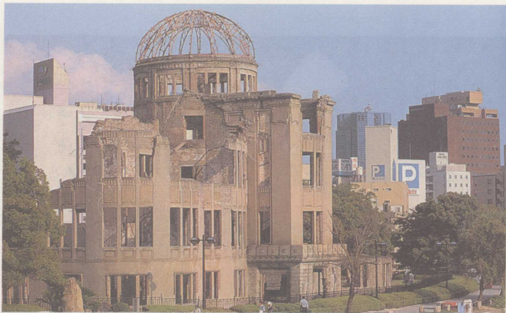
原子弹在广岛爆炸毁坏的建筑物圆顶