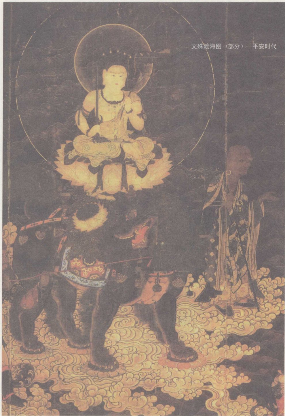
文殊渡海图（部分） 平安时代