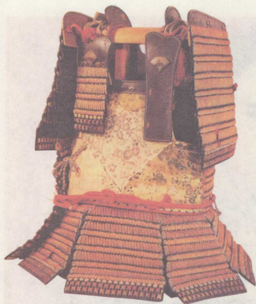
◀ 赤丝缀铠 镰仓时代