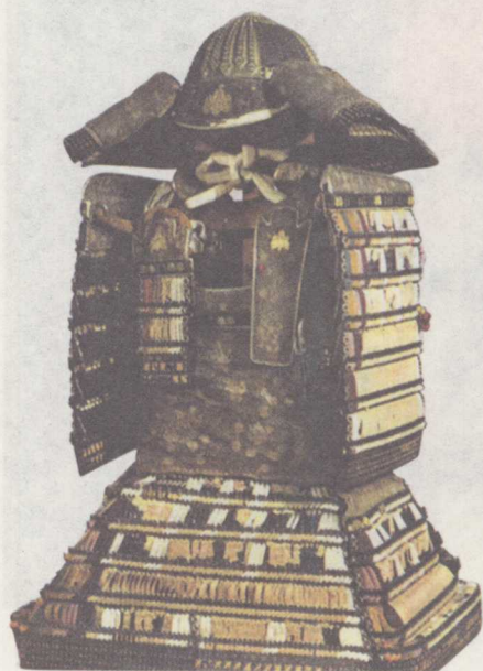
▼ 白丝缀铠甲 室町时代