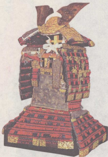
▲ 红线缀绳大铠甲 镰仓时代