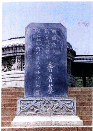
贵州省大方县城北乌龙坡头的奢香墓