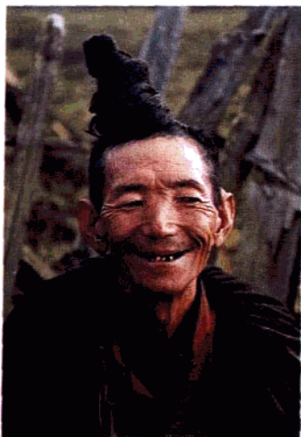
小凉山彝族天菩萨