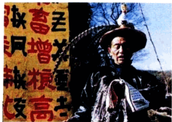
毕摩在祭祀中念颂彝文经书