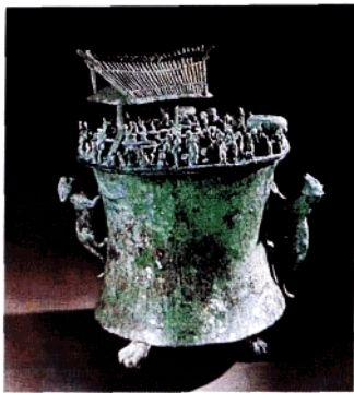
晋宁石寨山出土的“盟誓” 场面贮贝器（西汉中期）