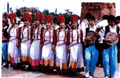
载歌载舞的彝族青年