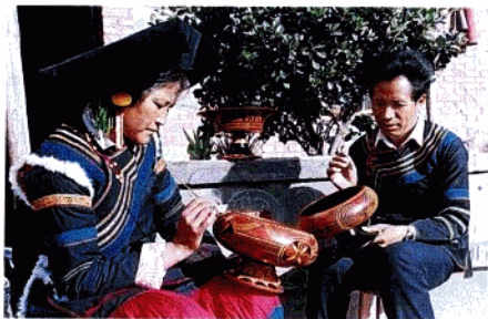
民间艺人制作工艺品