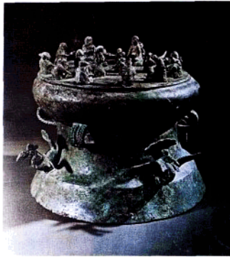
晋宁石寨山出土的纺织场面 贮贝器（西汉）