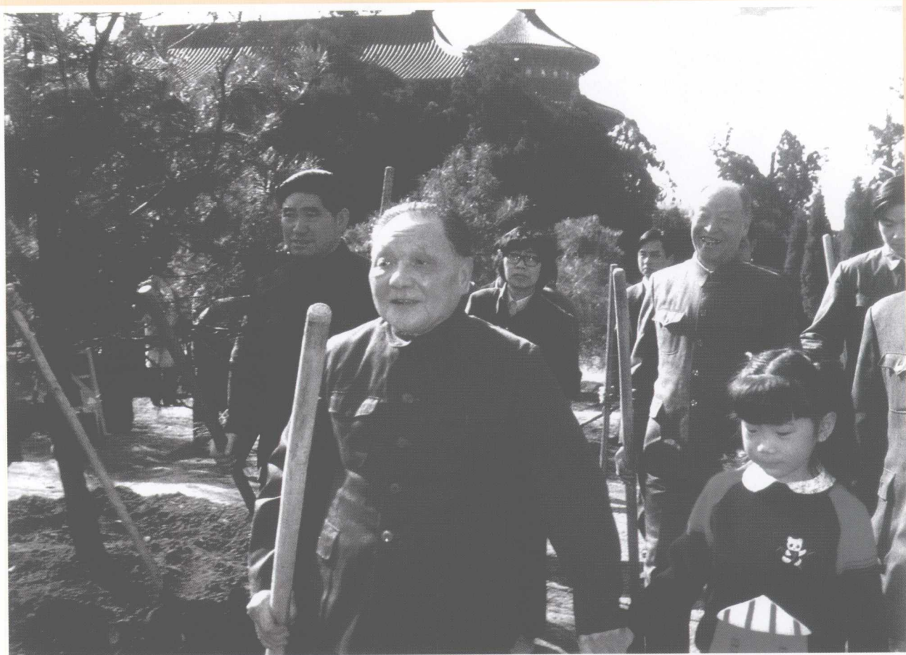
1986年4月6日，党和国家领导人邓小平、彭真等到天坛公园植树