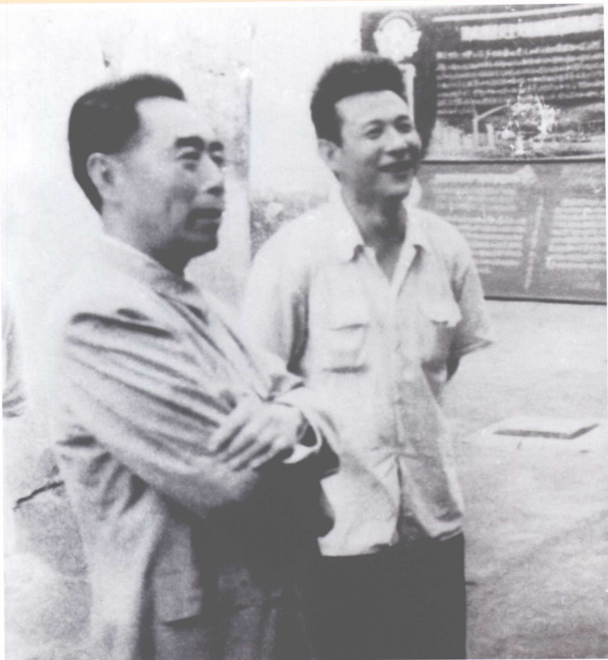
1958年6月1日，国务院总理周恩来视察天桥百货商场