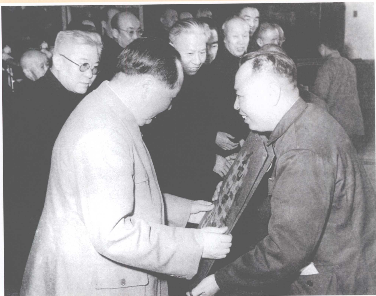
1956年1月，党和国家领导人毛泽东、刘少奇等 在天安门城楼上接见北京象牙雕刻厂老艺人杨士惠