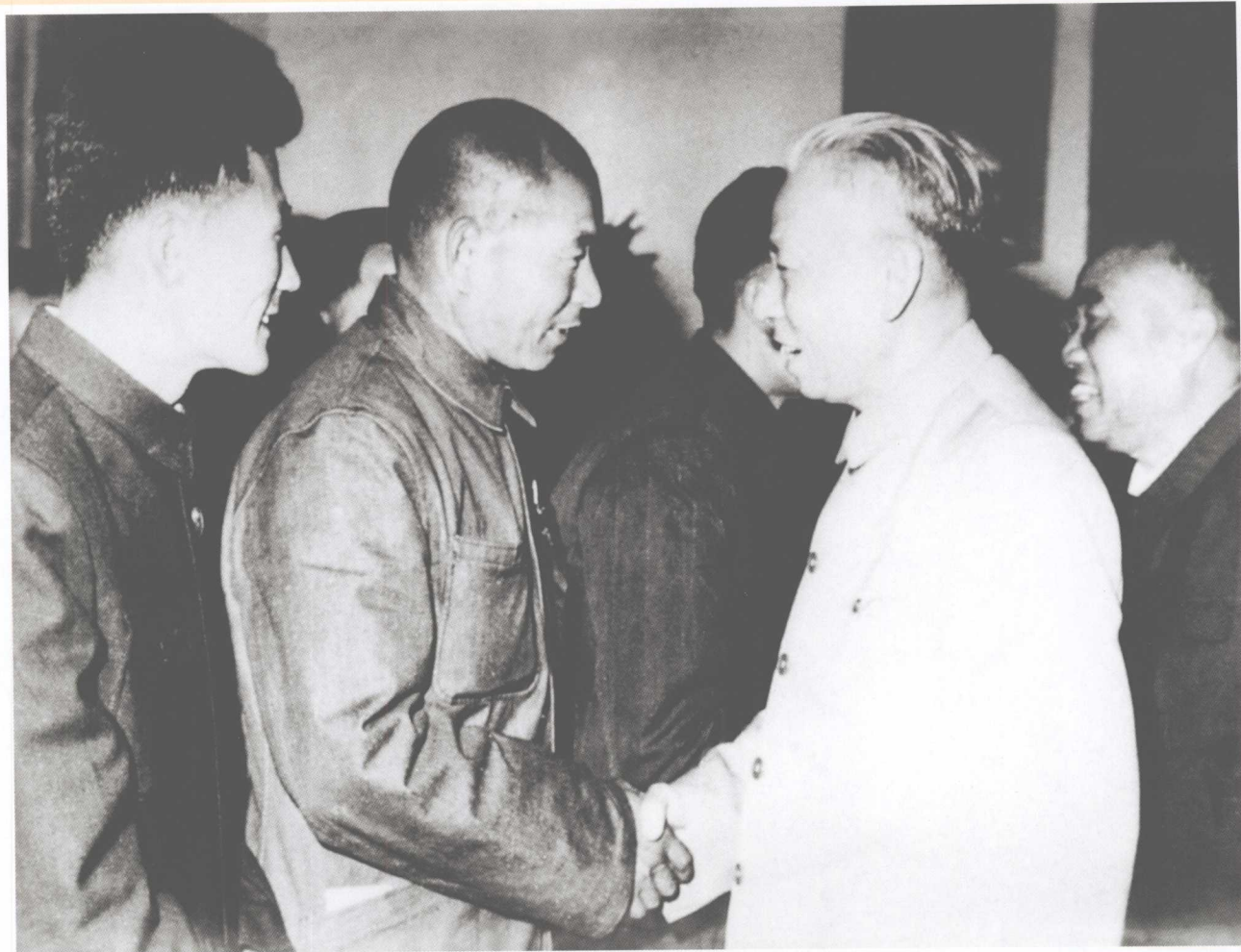
1959年10月，党和国家领导人刘少奇、朱德等在全国“群英会”上 接见崇文区清洁工人时传祥