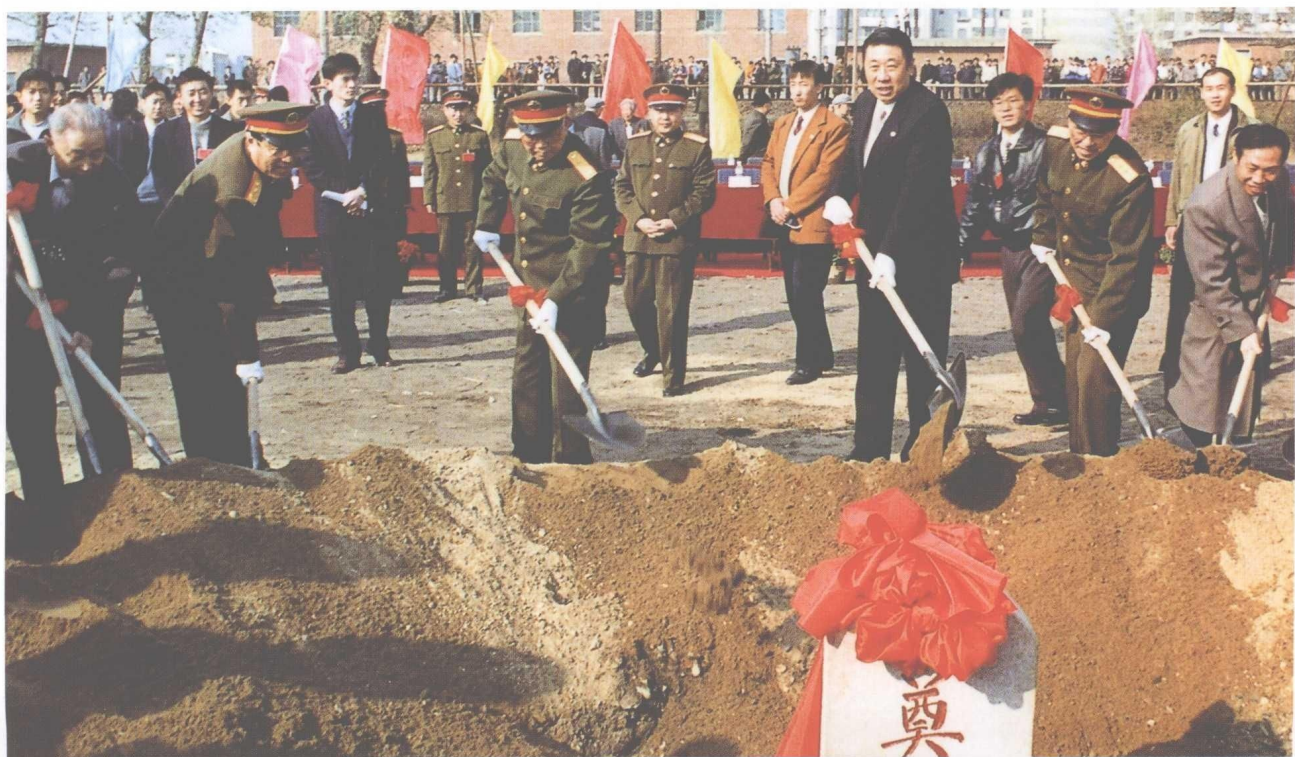
▼ 原军委副主席刘华清于 11 月 2 日在沈阳参加“九·一八”事变纪念馆扩建工程奠基仪式