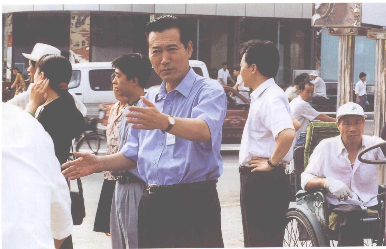
▲ 7月22日清晨，市长慕绥新走上街头亲自参加“十万市民参加交通执勤一小时活动”