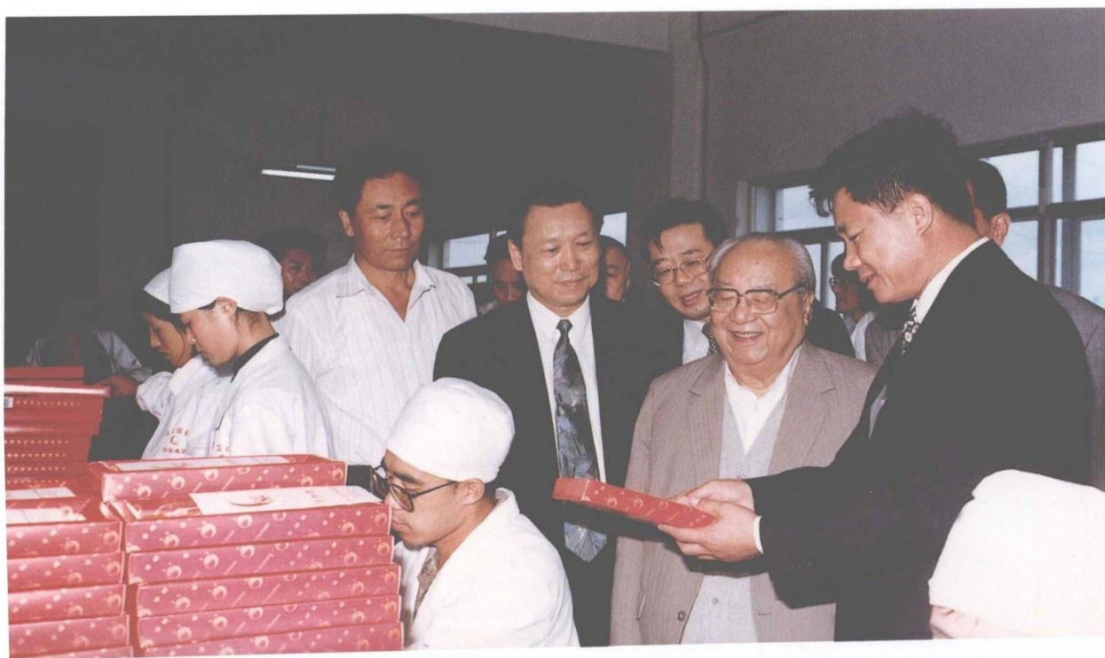
9月1日,全国人大副委员长费孝通在市人大主任张荣茂陪同下视察沈阳金龙保健品公司