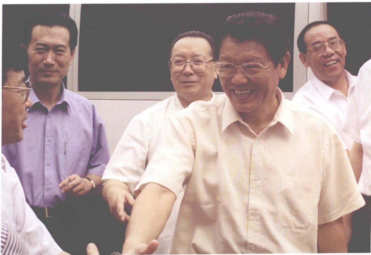
8月19日,国务委员李铁映视察东大软件园