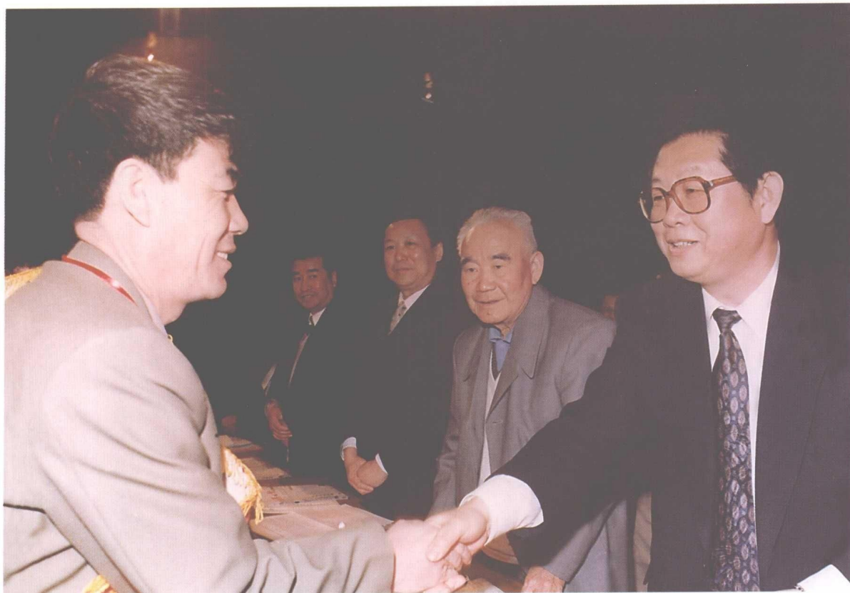
▲ 4月25日，市委书记张国光在沈阳市先进集体劳动模范表彰大会上颁奖