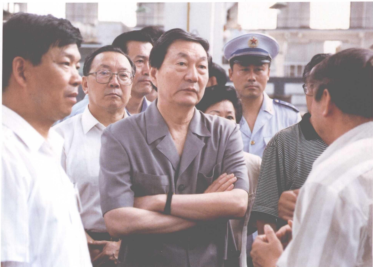
▲ 国务院副总理朱镕基 7 月 18 日至 24 日在辽宁考察国有企业