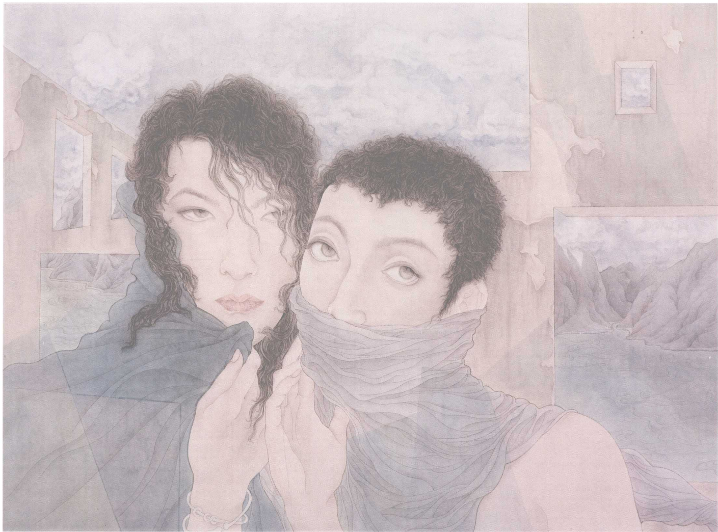
▲ 半生空 45cm × 66cm 2008年