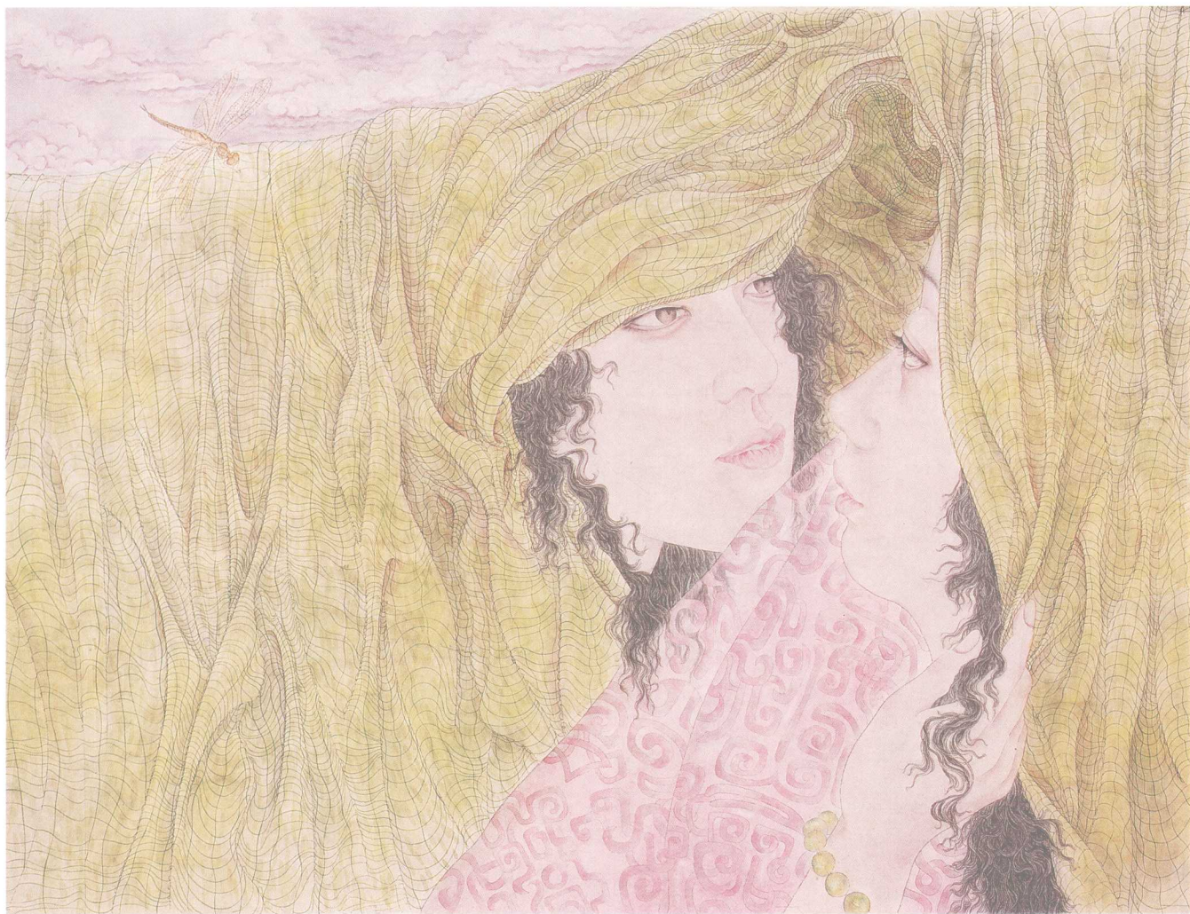
醉花阴 45cm x 66cm 2008年