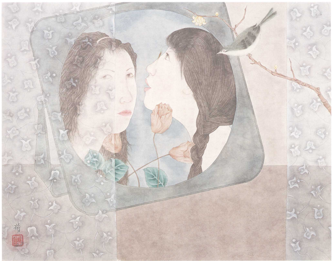
镜中缘 45cm x 50cm 2006年