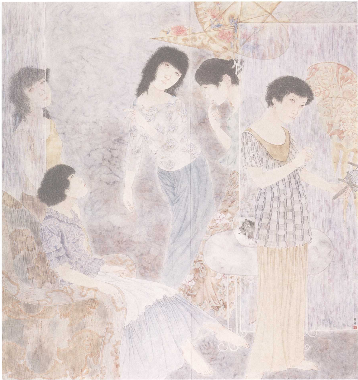
春事 200cm × 165cm 2007年