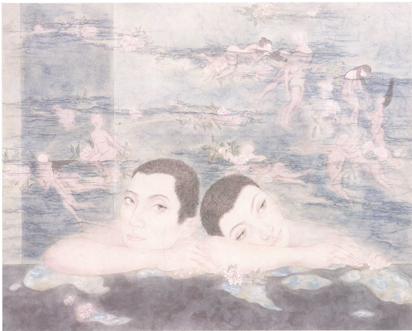
两生花 66cm×90cm 2008年