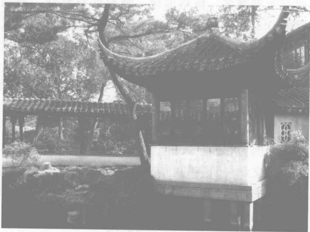
图3 拙政园松风水阁

古代汉语中也有类似的情况，即使在距离原始社会已经很远的春秋战国时代，仍然存留很多丰富的对于同一类事物进行细微区分的词汇。《诗经》中因为涉及很多物种，并且字里行间透露着古人和这些“品物”亲密无间的消息，所以，孔子才认为《诗经》除了能让人“迩之事父”、“远之事君”之外，还能让人“多识鸟兽草木之名”，但是，这些《诗经》中用到的称呼“品物”的词汇即使早在秦汉时代就已经有很多因为停止使用而不为人知，于是，才有了后来像三国陆玑的《毛诗草木鸟兽虫鱼疏》、宋代蔡卞的《毛诗名物解》、明代冯复京的《六家诗名物疏》、清代陈大章的《诗传名物集览》和日本冈元凤的《毛诗品物图考》等著作，对《诗经》中提到的“品物”进行考据讲解。《诗经》中对自然界一草一木如数家珍般的歌咏和生动细致的描绘在今天的语言中由于专门术语的缺失而成为一种困难，语言的演变中令人遗憾地