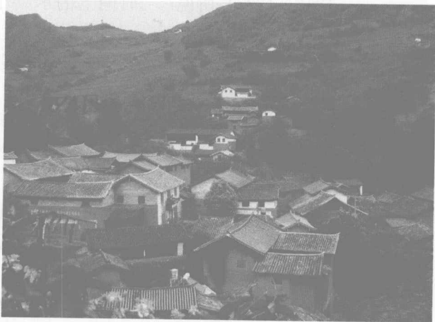
图1 “散布于田庄中的住宅”(云南大理诺邓古村)

李约瑟 (Joseph Needham, 1900~1995) 博士认为, “再没有其他地方表现得像中国人那样热心于体现他们伟大的设想‘人不能离开自然’的原则, 这个‘人’并不是社会上的可以分割出来的人。皇宫、庙宇等重大建筑物自然不在话下, 城乡中不论集中的, 或是散布于田庄中的住宅也都经常地出现一种对‘宇宙的图案’的感觉, 以及作为方向、节令、风向和星宿的象征主义。” ① 其中提到的宇宙中的“宙”和“时令”都是指的时间。李约瑟敏锐地看到了中国传统建筑和时间之间的重大关联, 但是没有专门就这个问题展开讨论, 而只是使用了很有感性色彩的“感觉”一词, 并且把这种关系归结为西方话语体系中的“象征主义”, 其实, 在他所谓的“呈现”背后, 隐藏着深刻的思想根源以及复杂的观念系统, 远非一种“感觉”而已。其中, 对时间的理解、这种理解在构筑“宇宙图案”中所