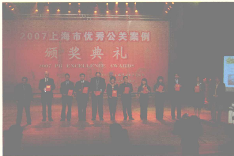
银奖获得者与颁奖嘉宾合影