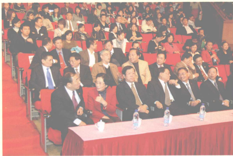
中共上海市委常委杨晓渡(前排左一)、市人大常委会副主任任文燕(前排左二)、市政协副主席黄关从(前排左三)等领导在颁奖典礼上