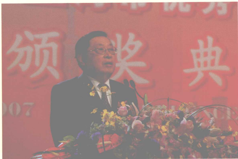
上海市公共关系协会会长毛经权教授在颁奖典礼上致辞