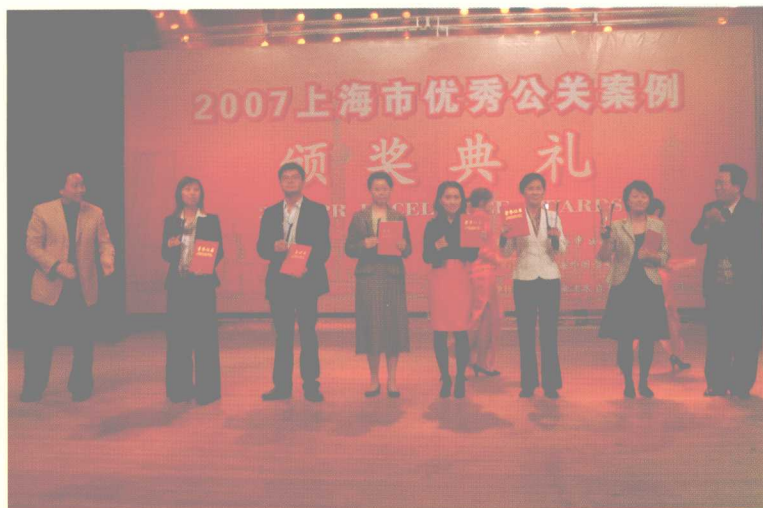
最佳公众参与奖获得者与颁奖嘉宾合影