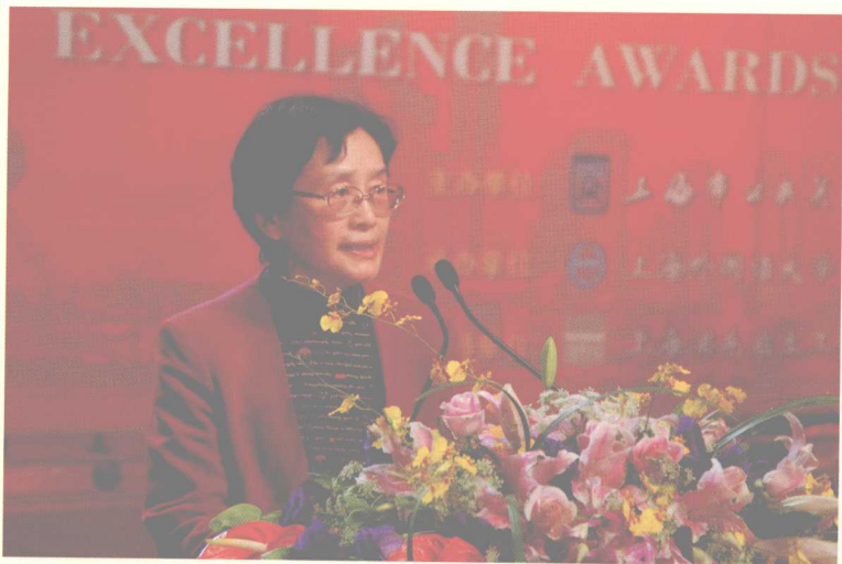
市人大副主任任文燕在颁奖典礼上致辞