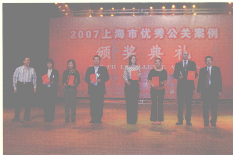
最佳实施奖获得者与颁奖嘉宾合影