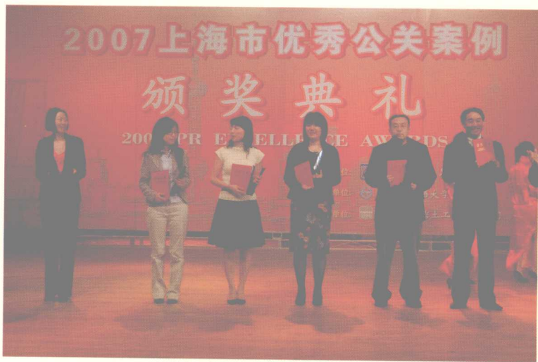
最佳创意奖获得者与颁奖嘉宾合影