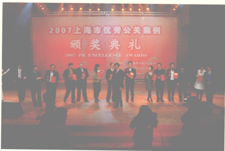
金奖获得者与颁奖嘉宾合影