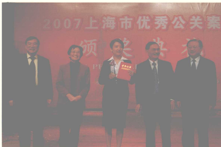
最高荣誉奖获得者(中)与颁奖嘉宾合影