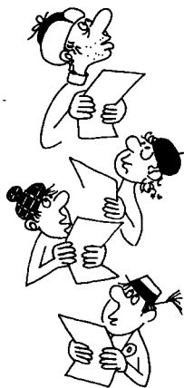
一种全世界普遍存在的痛苦。

就如同农夫用木犁耕种田地一般，他们耕种的是脑袋里的那块田，他们用中世纪的古老方式学习：