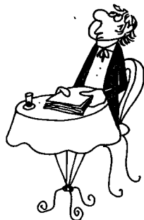
仰望天空的学习方式。

然而破产法中内容的重要程度也有所不同，所以他使用各种不同颜色的笔，最重要的用红色，次