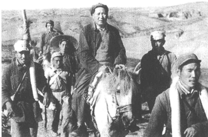
1947年，毛泽东在转战陕北途中。

清晰可见了。回溯党报发展史，这是有先例的。在抗日战争中创办于延安的《解放日报》即是这样的“大党报”：它是中共中央机关报，不久又承担西北局机关报的任务。由于战争形势，延安《解放日报》还不能做到在全国范围内的发行，它的主要影响力比较集中在西北地区，尤其是在陕甘宁边区的范围内。现在，随着战争局势向好的方向发展，办一张影响力更大的“大党报”具备了条件。