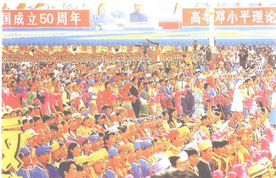
各族师生身着节日盛装参加建国 50 周年庆典