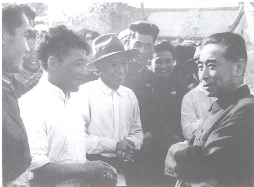
1956年，周恩来总理视察学校时，与各族师生亲切交谈