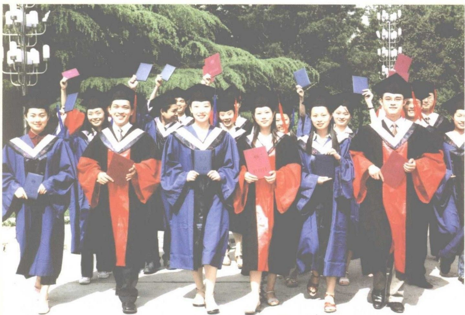
现在每年有 3000 多名毕业生从这里走上社会