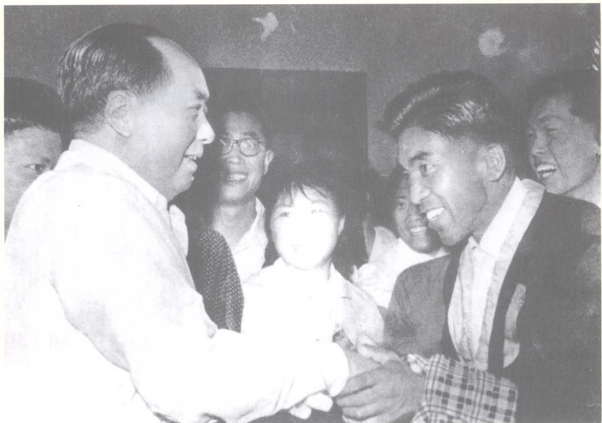
1964年，毛泽东主席接见我校干训部学员著名登山运动员——贡布