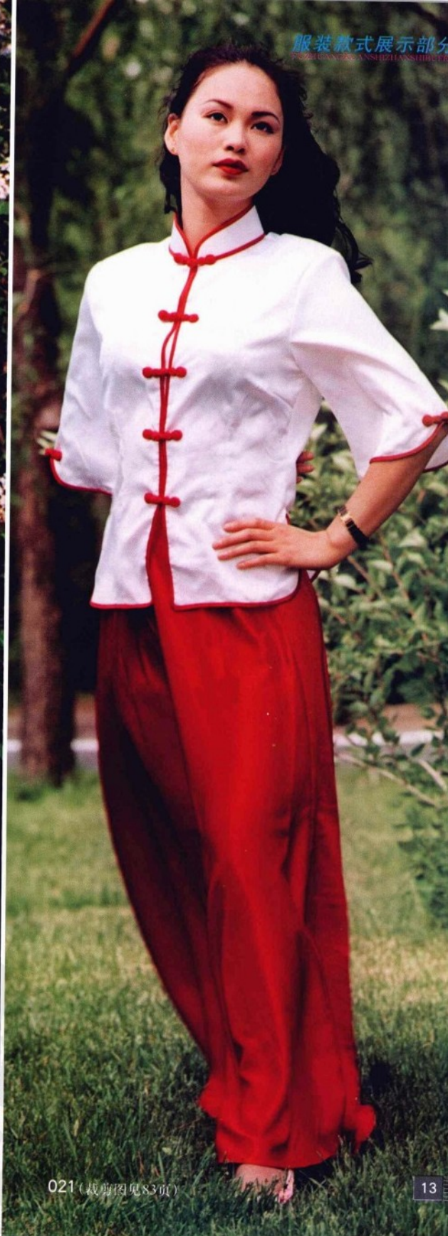
021 (裁剪图见 83 页)