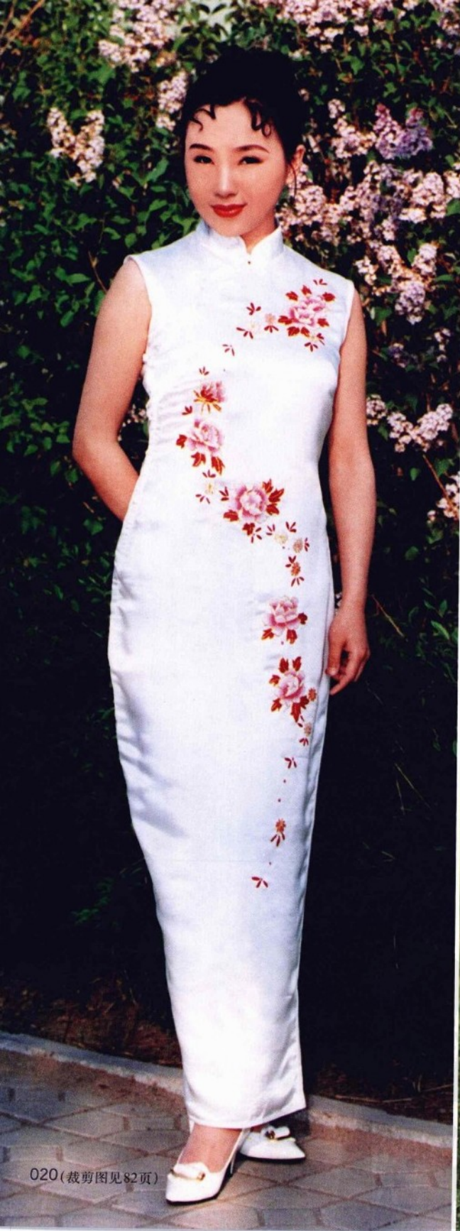
020 (裁剪图见 82 页)