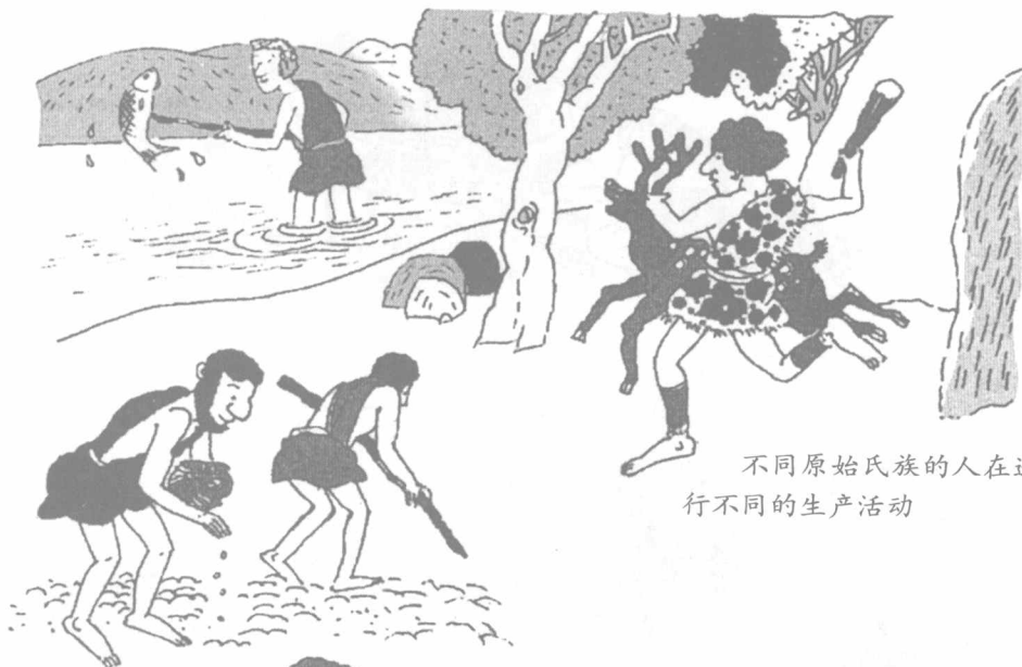
不同原始氏族的人在进行不同的生产活动