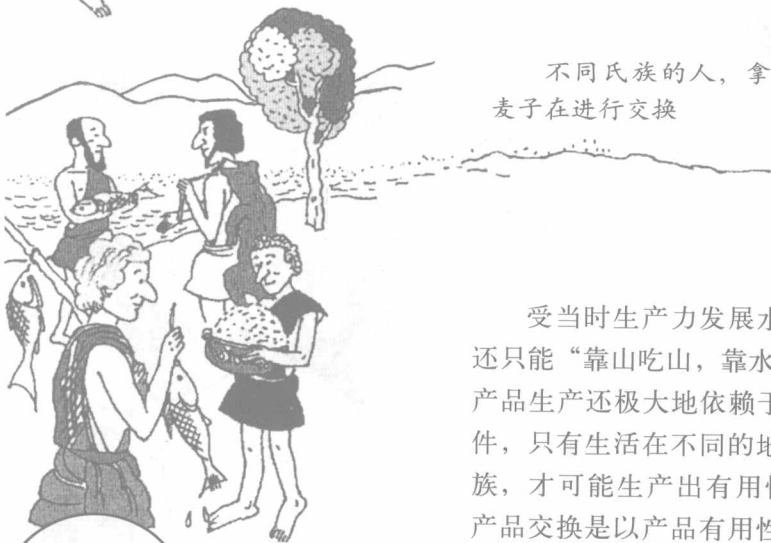
不同氏族的人，拿着猎物、鱼、麦子在进行交换