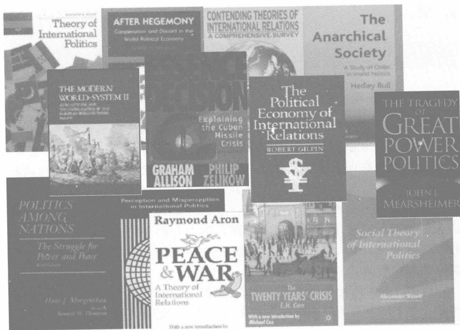
图片说明：国际关系经典著作。