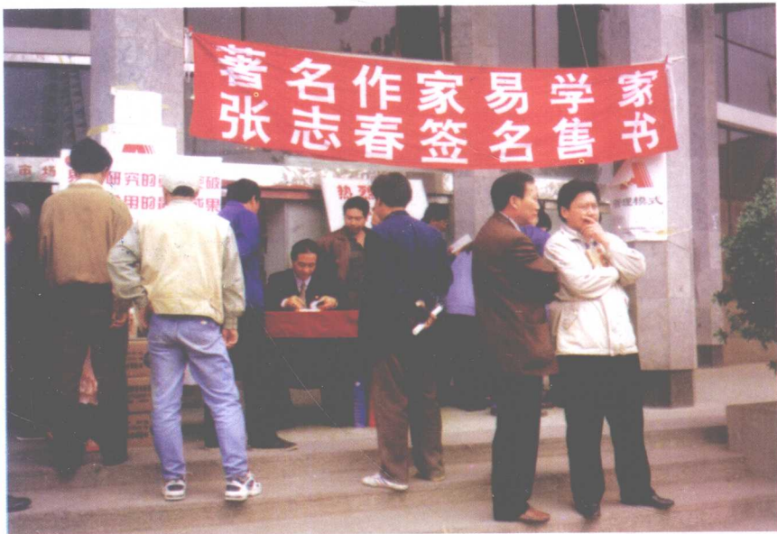
▲ 《神奇之门》出版后，1999年5月，作者在石家庄第二届图书交易会上签名售书两天。