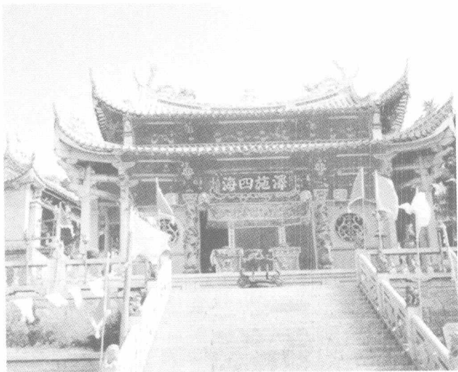
湄洲媽祖廟 太子殿 所供媽祖神像