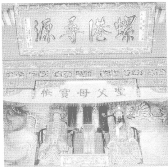
港里天后祖祠供奉的妈祖父母像