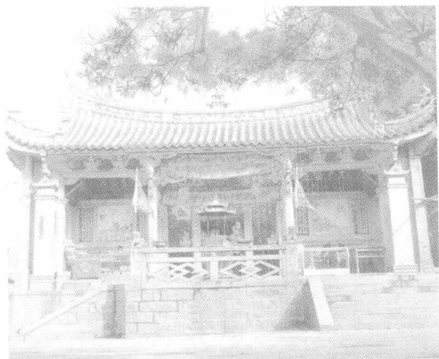
祖廟寢殿， 供媽祖及 水闕仙院 十八員神 像