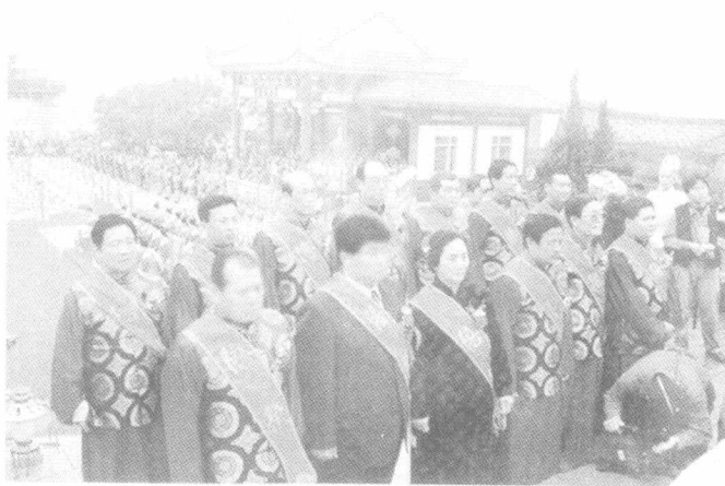
两岸同胞在湄洲祖庙共祭妈祖