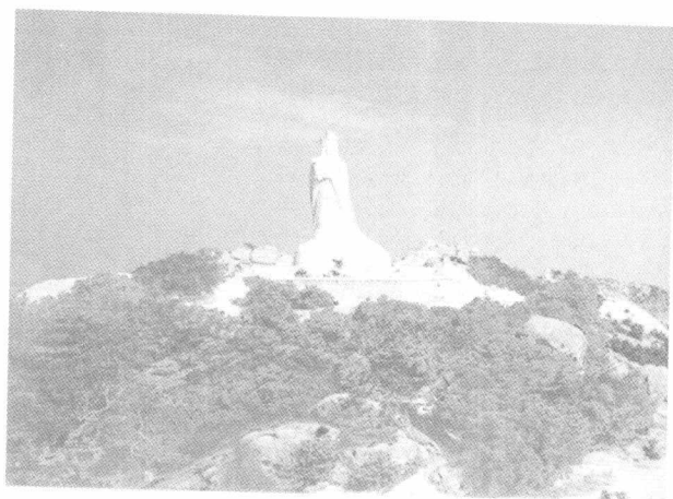
矗立在湄洲 祖庙山巅的 高 14 米 的妈祖雕像