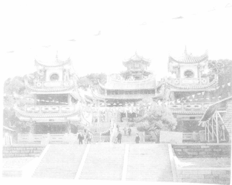
湄洲妈祖祖庙风采