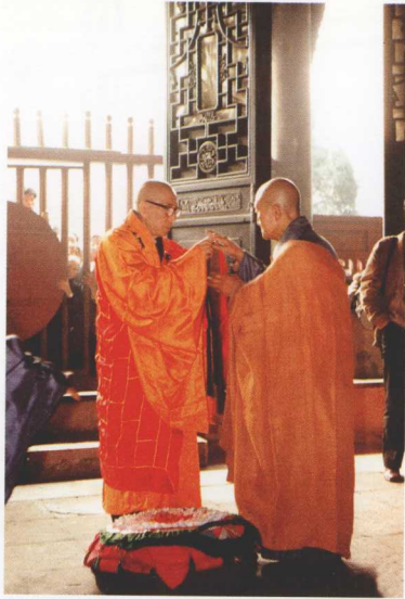
一九八八年，遍能法师受宝光寺大众之请，出任该寺方丈。照片中为升座仪式。