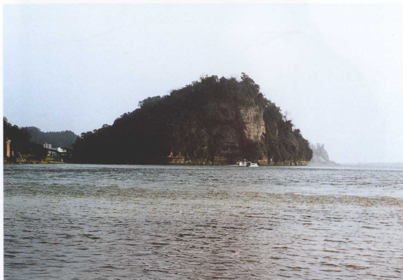
一堆绿影漂不去——乌尤山