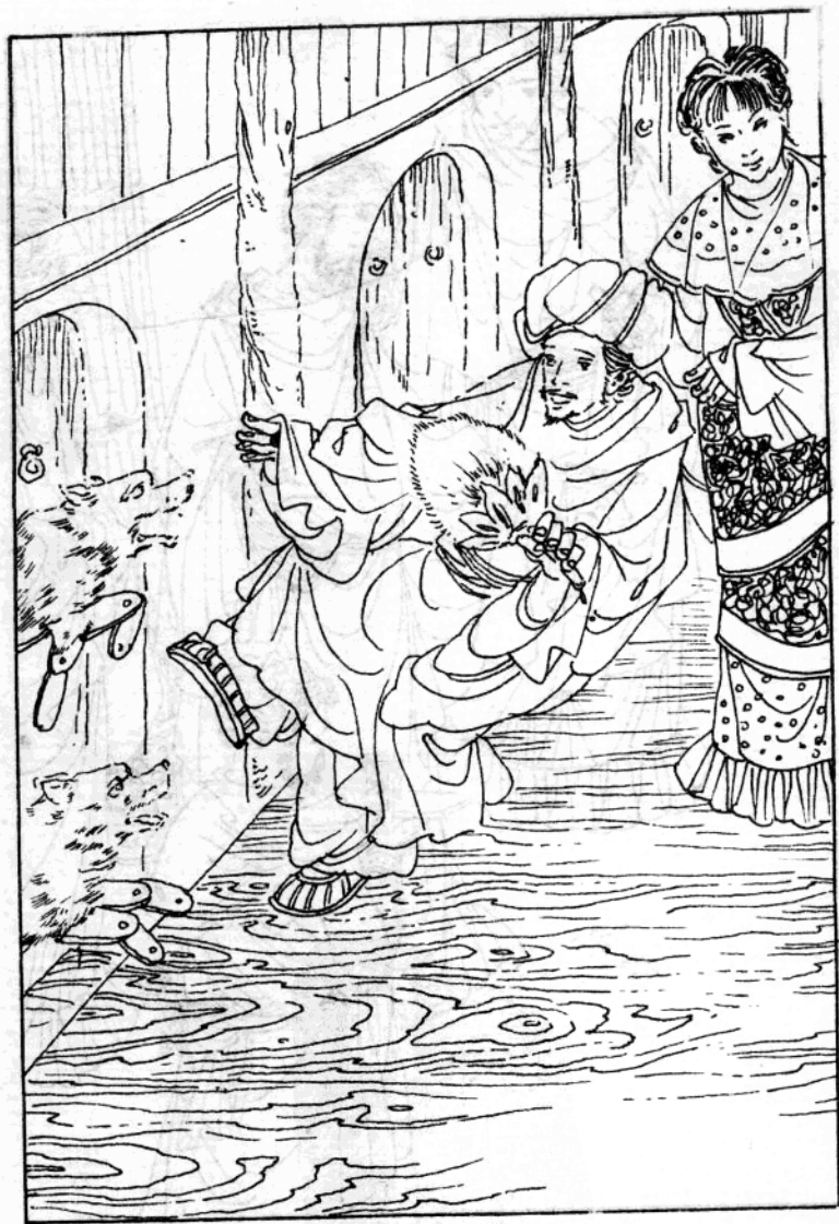
聪明绝顶的丑闺女