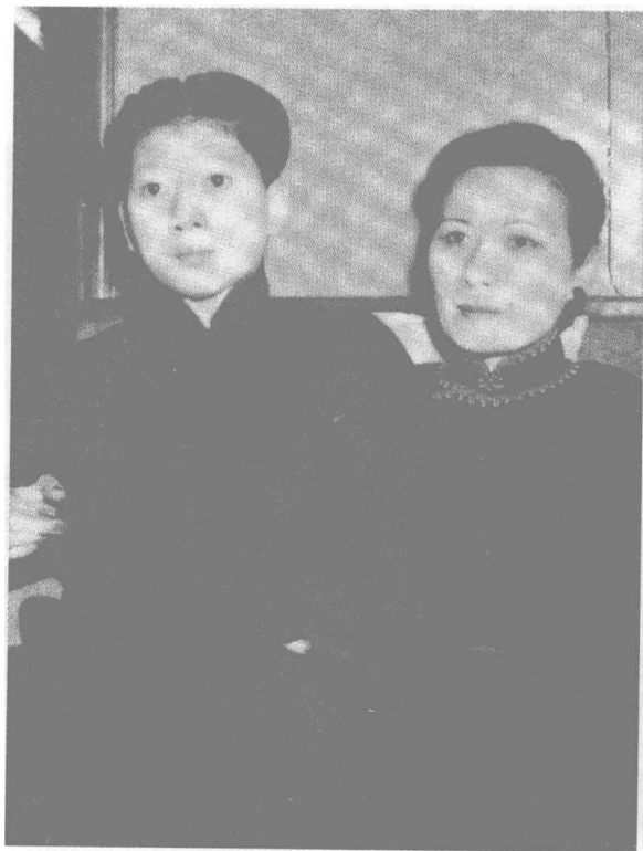
实为姨甥情同母女的宋美龄与孔二小姐。

等到那个喜欢佩戴手枪的“小男孩”长大了，跟在夫人身边打理大小事项，传言中开始显出她琐碎、严厉的一面，又听说她爱喝酒、爱查勤、对待下人苛刻。中年到晚年，由官邸、