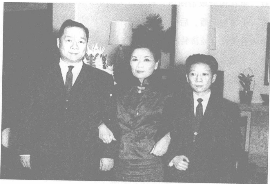
已步入中年的“左右金童”：左为孔令侃，右为孔二小姐。

1992年8月1日，宋美龄最宠信的“金童”孔令侃，因肺癌病逝于美国纽约，享年七十五岁，并且归葬于纽约市郊HARTSDALE的FERNCLIFF墓园——孔宋家族包括孔祥熙和宋