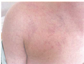
彩图 11 胸胁部瘀络