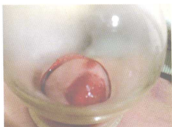
彩图 1 刺血拔罐·血瘀夹风