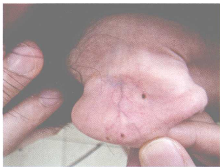
彩图 10 耳背瘀络