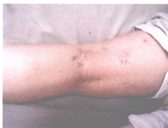
彩图 14 腘窝附近团块状瘀络