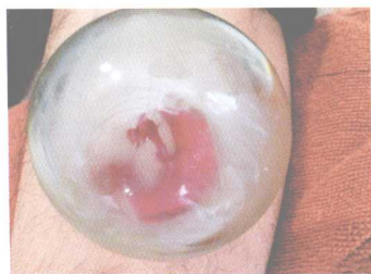
彩图 2 刺血拔罐·血热夹风