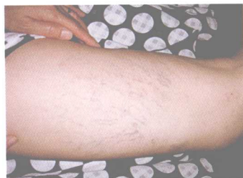
彩图 4 分支的络脉