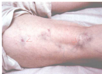
彩图 7 络脉扭曲如蚯蚓状