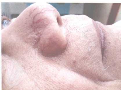
彩图 5 鼻尖部分叉的小瘀络(侧面观)