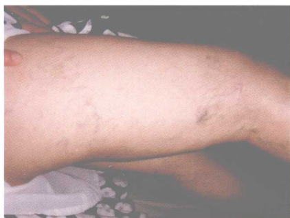
彩图 8 络脉呈团块状壅滞