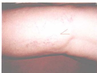
彩图 13 膝关节附近 小腿外侧瘀络