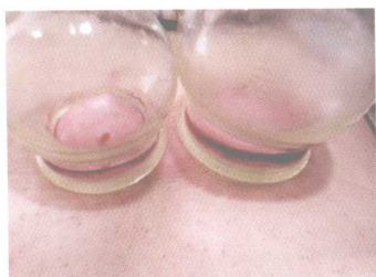
彩图 3 刺血拔罐·血瘀夹湿