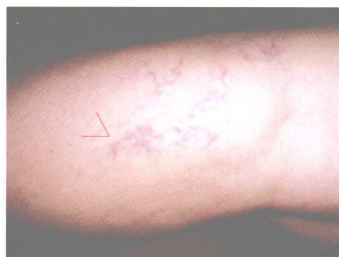
彩图 12 膝关节附近小腿外侧 蚯蚓状瘀络