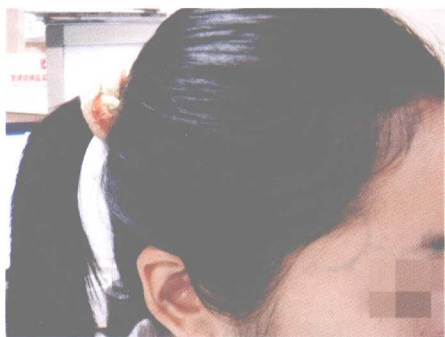
彩图 9 头颞部瘀络