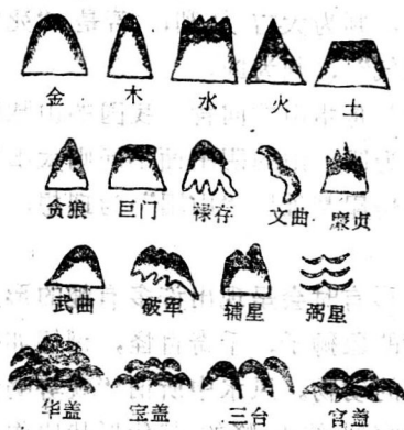
图1—2五星、九星、三台、华盖等示意图

对山形的吉凶判断还有许多其他方法，如赋予山形以特定的象征——五星说、九星说、三台说、华盖说等等（见图1—2）。五星是指金、木、水、火