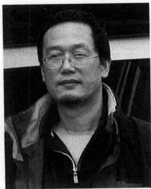
《西部地理》制片人：黄坚