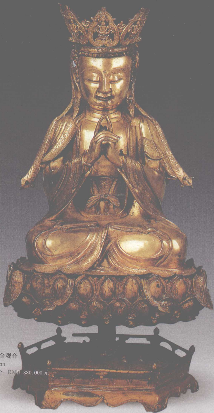
明 铜鎏金观音 高93cm 参考价：RMB 880,000 元