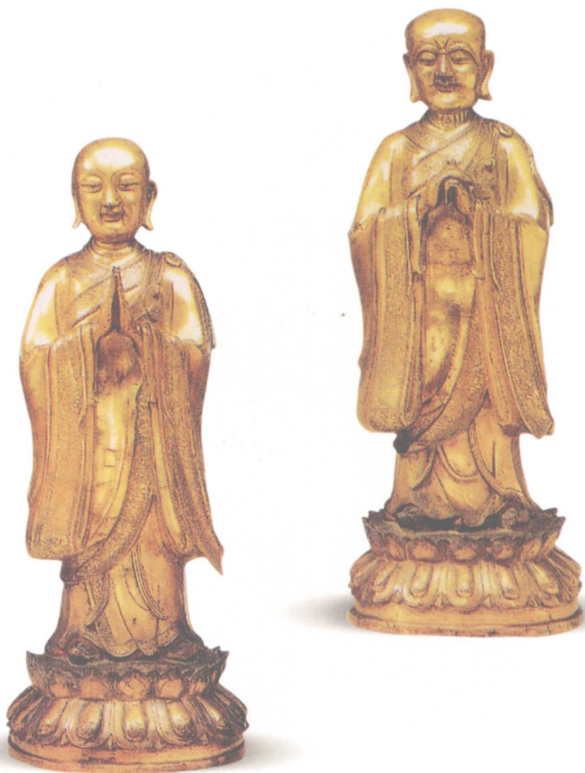
明 铜鎏金罗汉（一对）