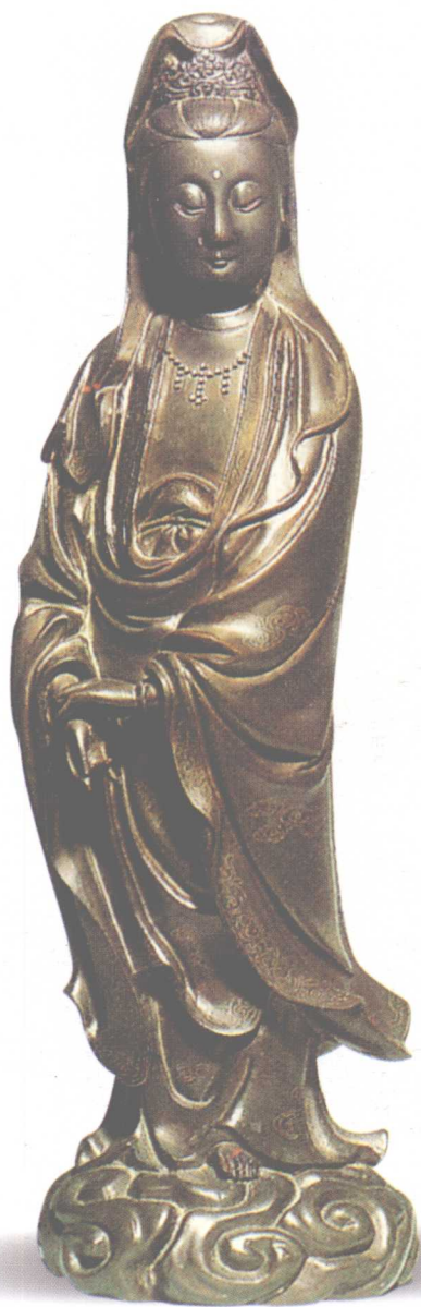
清 铜银观音 高 50cm 参考价：RMB 480,000 元