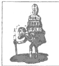
漫画二：教师的压力