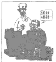
漫画一：教师的职业病