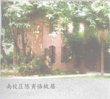
南校区陈寅恪故居