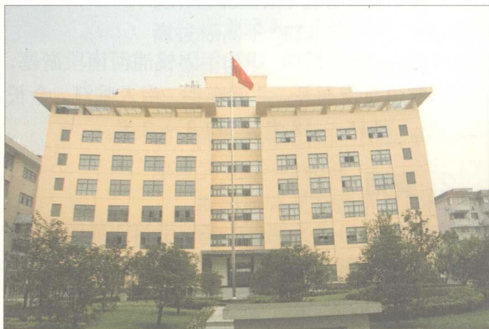
真如镇人民政府大楼

民国十六年（1927年）7月上海成为特别市，1928年7月真如改乡为区，划属上海特别市管辖。抗日战争期间，1939年，真如改属伪市政督办公署闸北区，1940年5月改属上海特别市沪北区。1945年9月，国民党政府将真如区一分为二。1946年3月恢复原来真如区建制，定为三十二区。1947年1月三十二区改名为真如区。