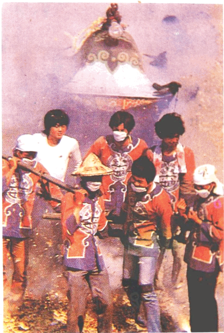
一、台灣的神明，經常會坐了轎子出巡。