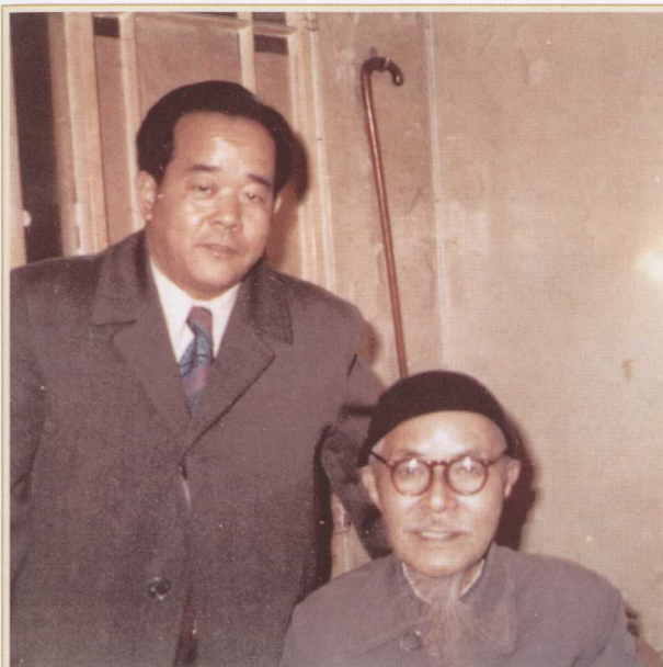
周颖南上海拜会丰子恺 (1972年)。