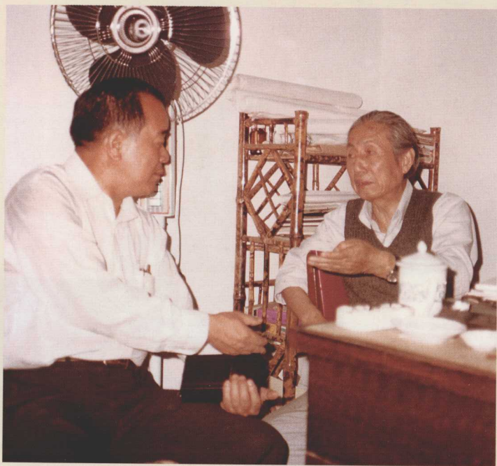
1981年5月29日，著名山水画家陆俨少在杭州寓所与周颖南欢叙。