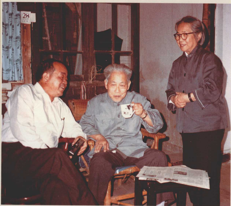
1981年5月29日，著名画家 诸乐三在杭州寓所与周颖南合照。 右为诸乐三夫人。