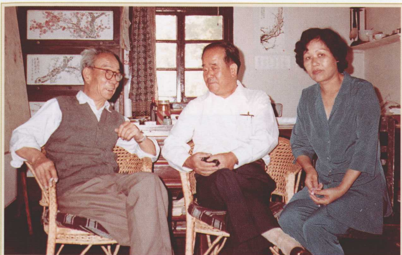
1981年6月1日，著名画家魏紫熙在南京寓所与周颖南夫妇欢叙。