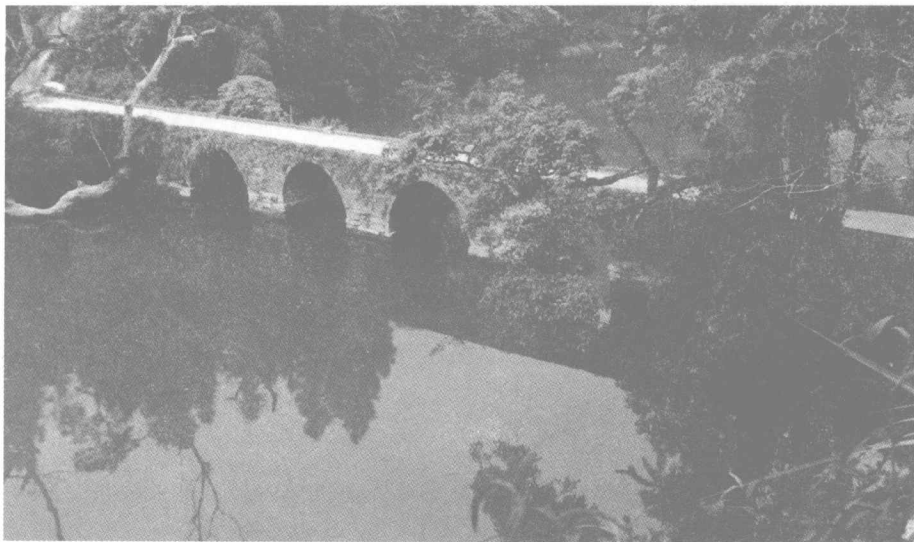
世界自然遗产——荔波小七孔