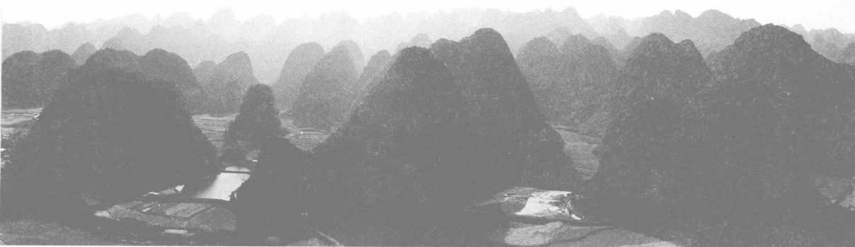
兴义万峰林——奇特的地质景观