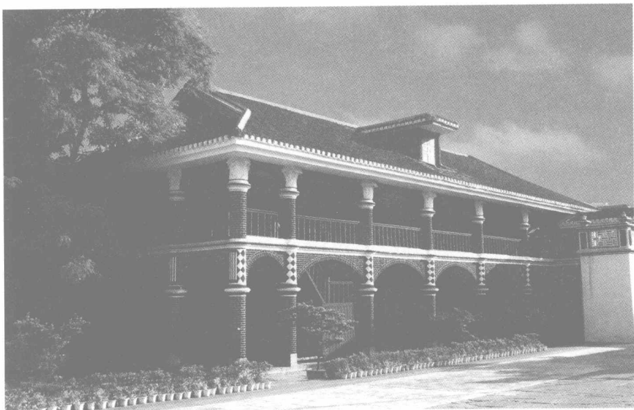
遵义会议会址——历史的转折在这里发生

到黔南人民的坚决抗击后，已成强弩之末的日军，忽然以极快速度向南退却，结束了在贵州的军事行动，同时也终止了他们在中国大陆的军事进攻步伐。如果说宛平城外的卢沟桥是日本大规模侵华战争的起点，贵州独山城外的深河桥，则是侵略者疯狂军事攻势的终点。近年来，学术界对黔南事变的研究方兴未艾，随着研究的逐步深入，独山这个昔日鲜为人知的小县，也一下成了人们心目中的英雄城市。