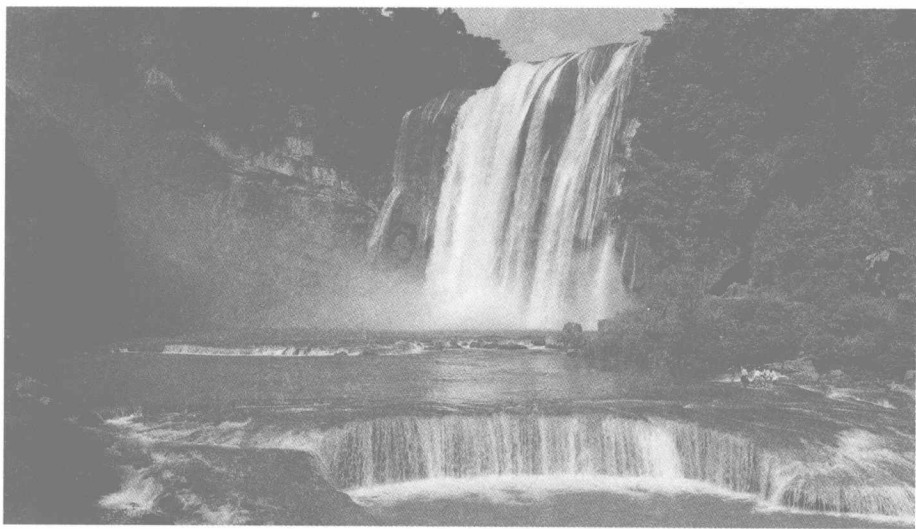
黄果树瀑布——神奇贵州的自然体现

不客气地说,当世界许多地方还是一片荒芜,渺无人迹的时候,坐落在云贵高原东半块的贵州地区,早已经是一派生机了。还在山顶洞人出现之前,水城硝灰洞人便已生活在距今六盘水市25公里的三岔河畔。他们运用智慧,率先创造出打制石片的锐棱砸击法。这种带有区域性文化特征的砸击法,后来虽然在西南一些地区、台湾和东南亚等地也有发现,但时间上以贵州硝灰洞最早,形制上也以硝灰洞最为典型。