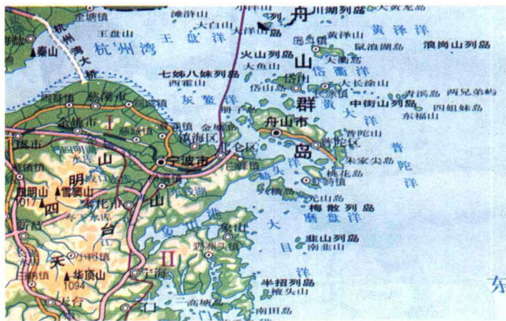
定海鸭蛋山至宁波白峰的车客渡轮及航线示意图

蓝色公路是指用“海峡轮渡”的方式把众多载客载货的车辆直接运送过海的交通运输路线。它的开通大大减轻了旅客进出海岛和货物运输途中奔波辗转的辛苦。