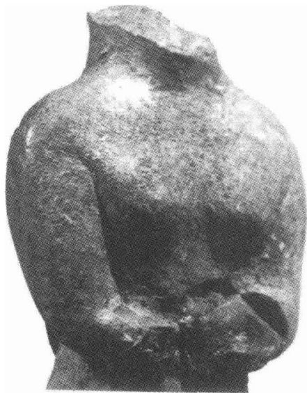
图0:3 牛河梁子出土的红山文化“女神”泥塑