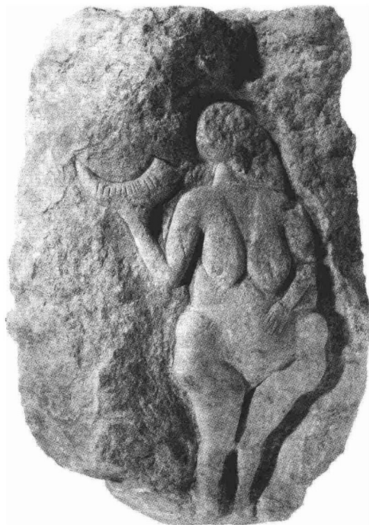
图0：2 欧洲旧石器时代的裸体女像（法国鲁塞尔洞）

蛇的诱惑下，夏娃不顾上帝的禁约偷吃了智慧树上的果子。于是，他们马上感到了善恶、真假，产生了羞耻之心。他们开始感到身上一丝不挂实在难堪。这样，他们就采摘了无花果树的叶子来遮掩身体。从此，人们从裸体走向了服装时代。这个故事，我们可以从很多西方的宗教名画中看到。有趣的是，正是这个故