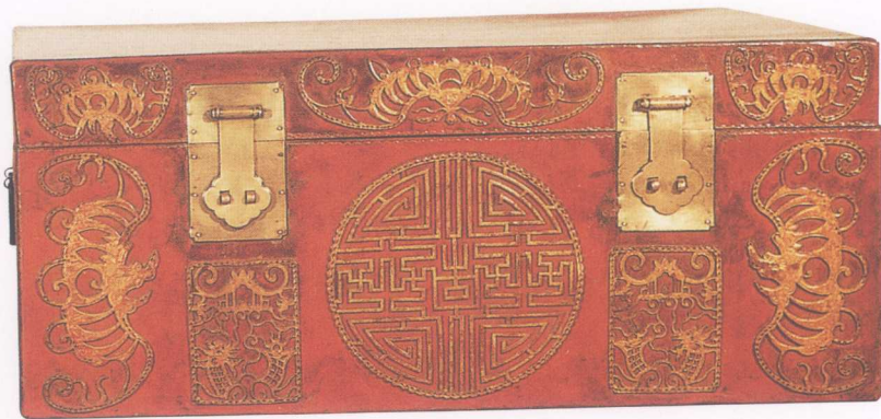
▲ 清中期·红漆描金大皮箱（一对）