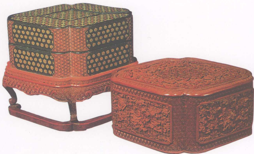
▲ 清乾隆·剔红雕花卉纹菱式多宝格盖盒