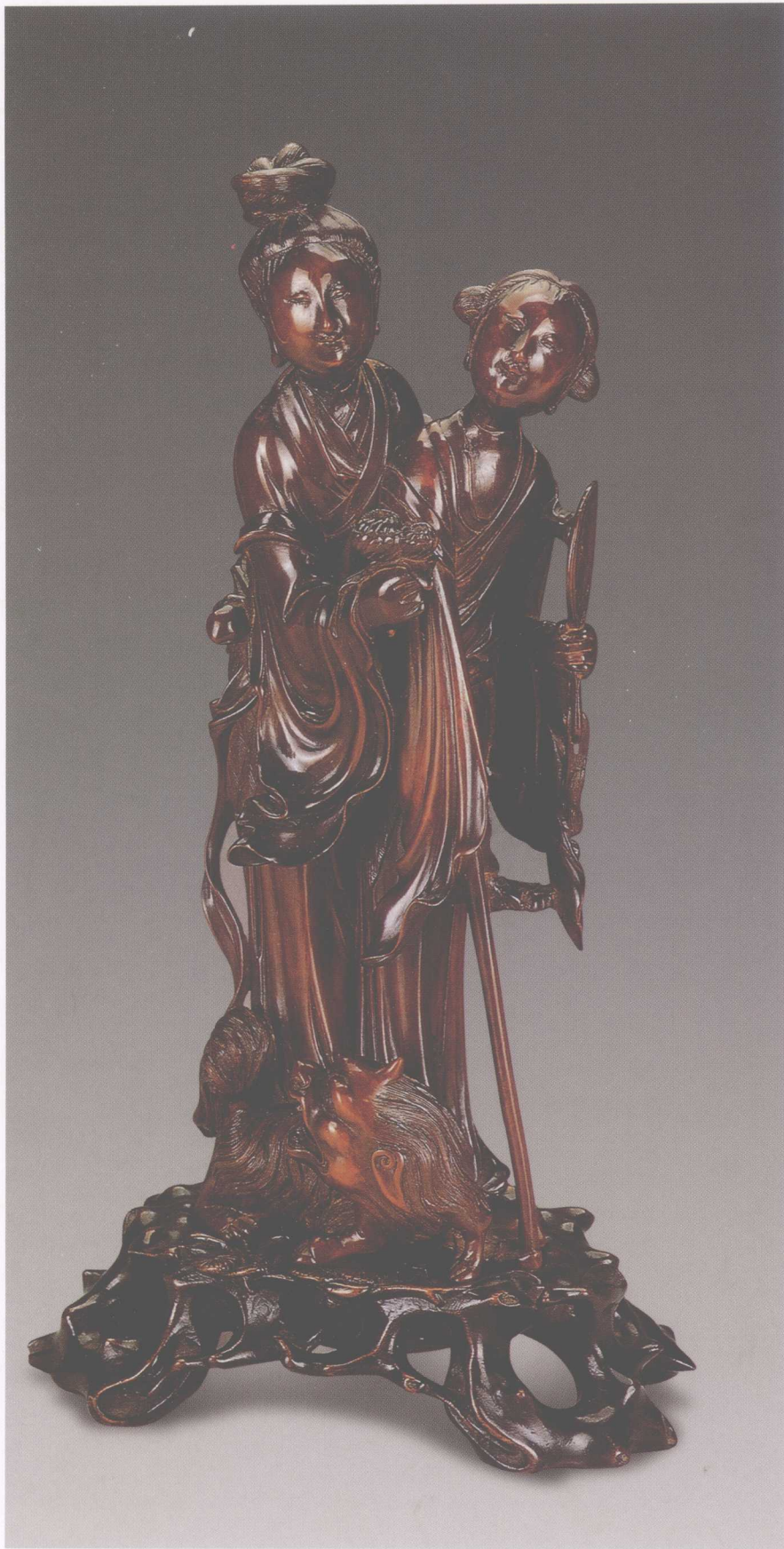
▲ 清·黄杨木雕祝寿仙女像