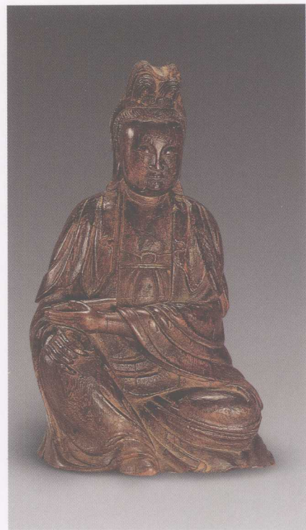
▲ 清·沉香木雕观音像