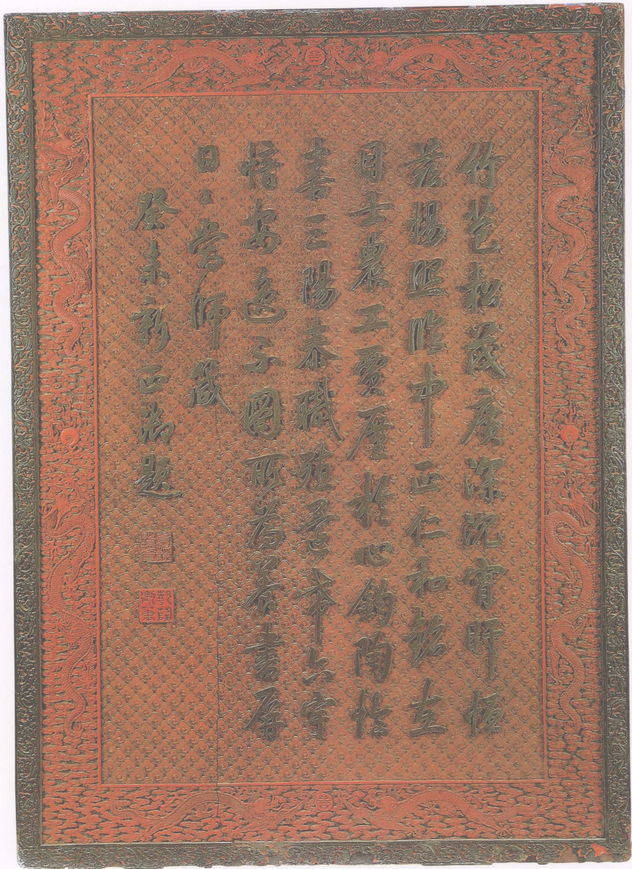
▲ 清乾隆·雕漆嵌绿石御题挂屏