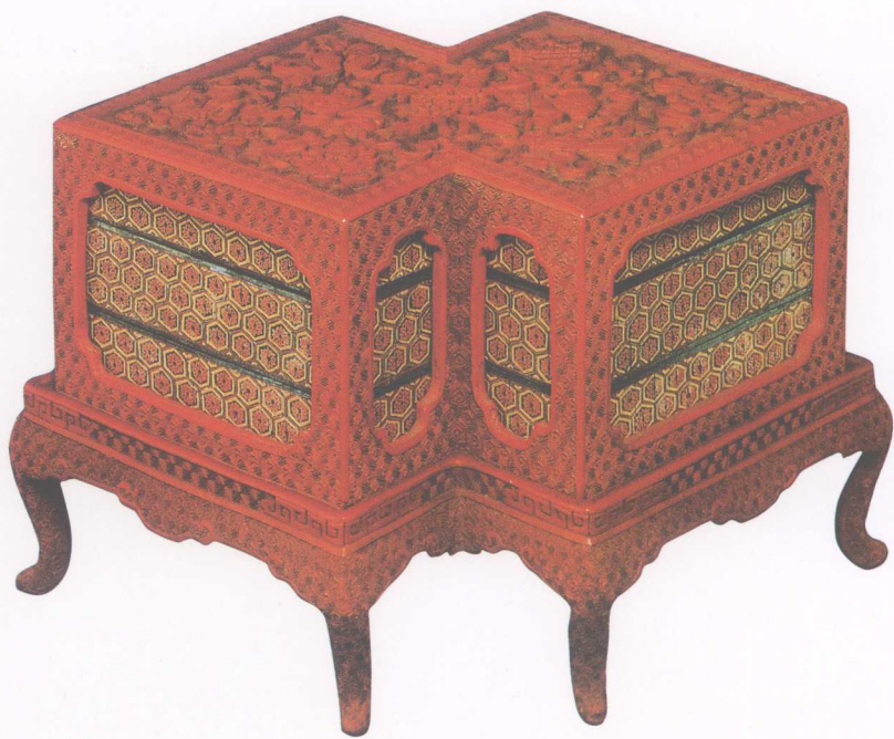
▲ 清·剔红八吉祥方胜套盒