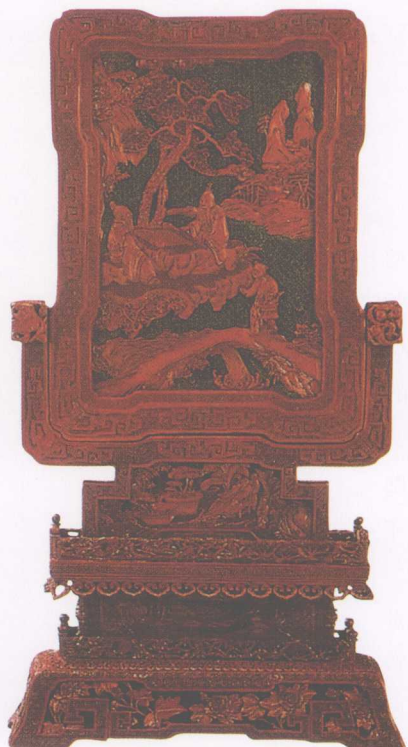
▲ 清·剔彩王质遇仙图插屏（一对）