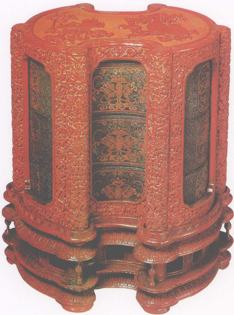
▲ 清·剔红座架三叠式盒

● 鉴赏要点：此盒为木胎，共三叠，盒盖为银锭式开光，于金色锦地上浮雕博古纹。盒内层以剔彩手法为主，外层以剔红手法为之，底座用剔红手法作成楼阁状，纹饰繁缛。