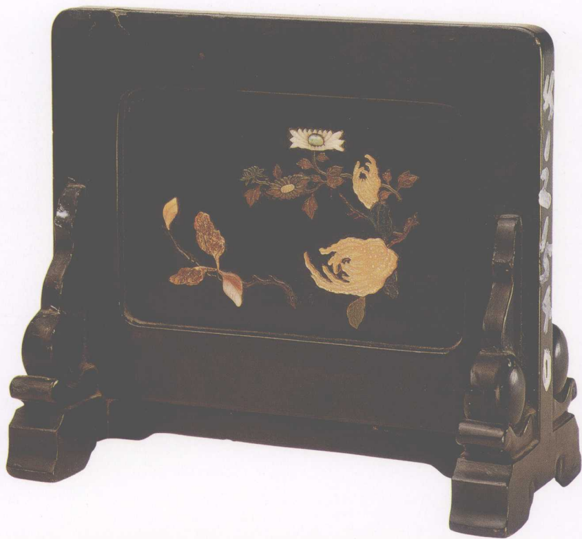
▲ 明·黑漆百宝嵌小插屏