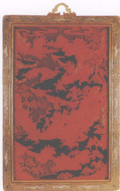
▲ 清乾隆·雕漆山水战士图挂屏（一对）