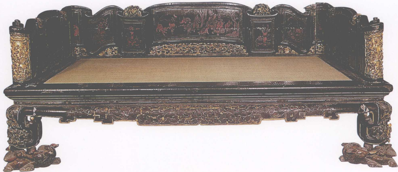
▲ 清中期·黑漆雕花描金罗汉床

● 鉴赏要点：此箱木胎包牛皮，罩红漆，三面皆为贴皮镂空描金狮子滚绣球和五蝠捧寿图，黄铜面叶、拉手与箱子整体协调一致，色彩华丽，为祝寿时所用器物。