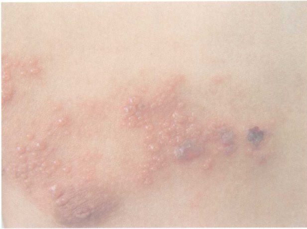
1-8 带状疱疹 (Herpes Zoster) 皮损沿T2感觉神经离心传播, 引起相应皮肤节段发生疱疹