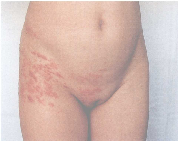
1-10 带状疱疹 (Herpes Zoster) 10岁女童。腰骶部神经受累, 引起相应皮肤节段发生疱疹