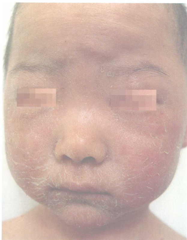
1-7 传染性单核细胞增多症 (Infectious Mononucleosis) 与1-6为同一患儿。图示面部皮肤干燥、潮红肿胀, 可见皲裂及脱屑