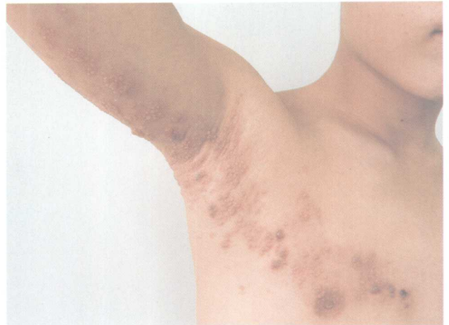
1-9 带状疱疹 (Herpes Zoster) 与1-8为同一患儿。皮损表现为水肿性红斑上成簇分布米粒至绿豆大小水疱, 局部有水疱融合和结痂