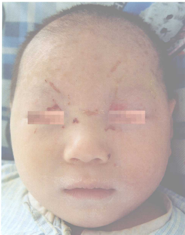
1-5 Kaposi水痘样疹 (Kaposi's Varicelliform Eruption) 与1-4为同一患儿。经静脉阿昔洛韦治疗及湿疹对症处理7天, 皮损恢复良好, 仅存面部少许结痂, 整个面部皮肤干燥