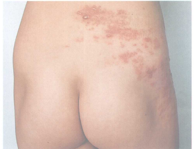
1-11 带状疱疹 (Herpes Zoster) 与1-10为同一患儿。上图患儿腰部皮损, 可见红斑基础上成簇分布的丘疹、米粒至绿豆大小水疱