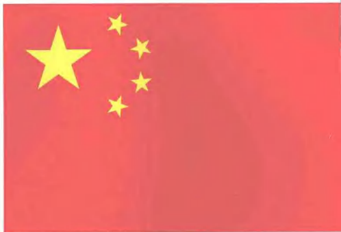
中华人民共和国国旗