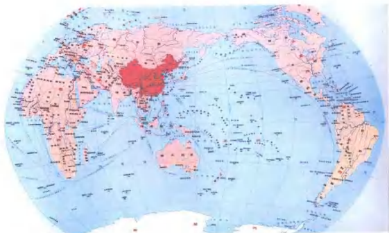
中国在世界的位置