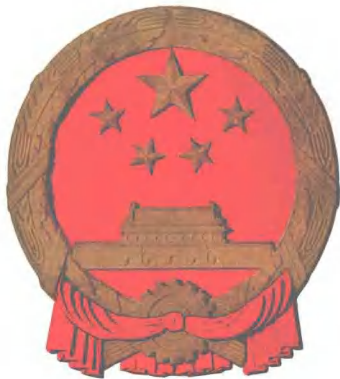
中华人民共和国国徽