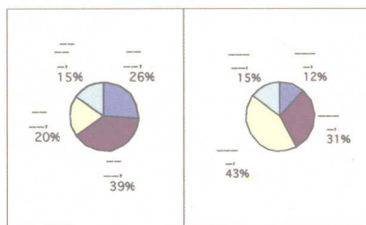
个人就业行为选择