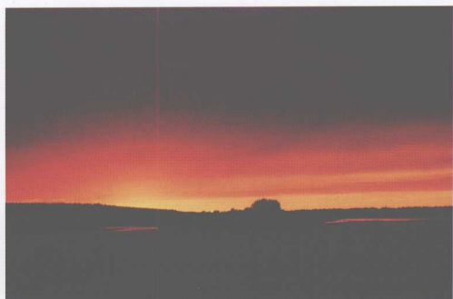
伏尔加入夜（“在太阳宁静落下去的地方，鲜红色的光辉短暂地照着渐渐昏黑的大地。”——屠格涅夫《猎人笔记》）

起源于俄罗斯中部高原低矮群山之中的伏尔加河是条好脾气的母亲河。为了汇流到南方的出海口，伏尔加河表现了她那极大的包容性——对于阻碍她往南流淌的矮小山脉，她不咆哮、不冲击，只是息事宁人地绕过它们，向东弯了一个大圈。在群山中左盘右旋地绕行过程中，她的长度也被抻长了，成