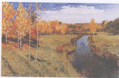
列维坦，金色的秋天，油画