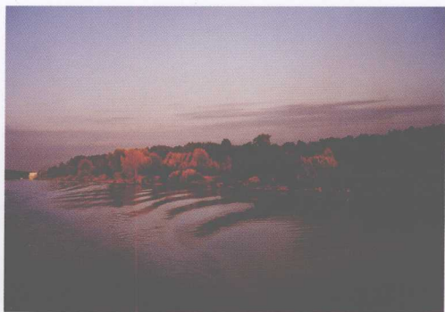
伏尔加之波（“河流和森林上闪烁着无数阳光的斑点：金黄的、深蓝的、翠绿的和霓虹的。”——《巴乌斯托夫斯基选集》）

一星期，就要求提前开支，然后，就拿着这笔钱去喝酒，只是在钱都花光后，才想到还得干活挣钱，而农场主地里的农活早已被耽误了。虽然伏尔加格勒州政府主管农业的领导知道“中国人的劳动态度给伏尔加沿岸的人树立了好榜样”，但是州政府还是不敢大批地接纳中国雇农，他们的担心和西伯利亚地区