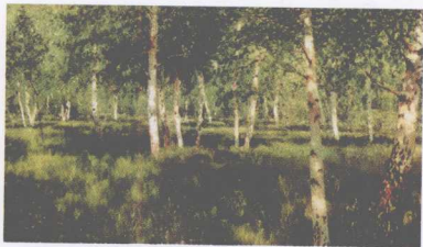
列维坦，桦树林，油画