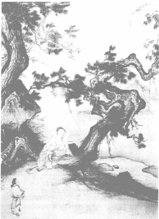
[明]八大山人《荷石图》