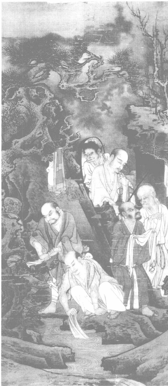
[南宋]林庭圭《罗汉洗衣图》

雪峰义存禅师生活于唐朝末年和五代十国的初期。他曾经随洞山禅师学习，在其门下做炊事员，话不投机后辞去，后来成为德山禅师的传人。大禅师常常将弟子逼到思想或意识领域的死角，然后要他们各觅生路。在这种情形之下，如果能够冲破这一关则豁然开朗。这则公案里，这些和尚其实都让雪峰失望了，只能退而求其次，那就在平凡中领悟吧。雪峰看那些和尚傻眼不回答，只能继续自言自语：“你们这些漆桶，不会搓大地丸子，就打鼓来看看吧。”