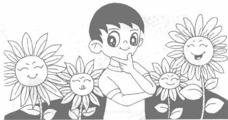
图 1-1 良好的意志品质

驾驶员具备良好的意志品质，对于克服困难完成任务和在危险情况下化险为夷都具有极为重要的意义。一个合格的汽车驾驶员应具备自觉、果断、坚韧、有自制力的意志品质，如图 1-1 所示。