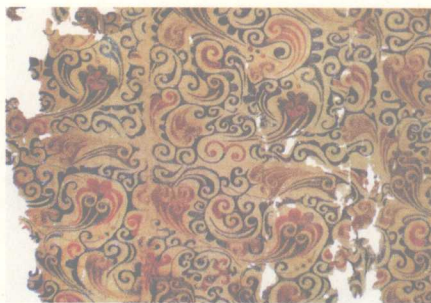
绢地长寿纹绣 西汉