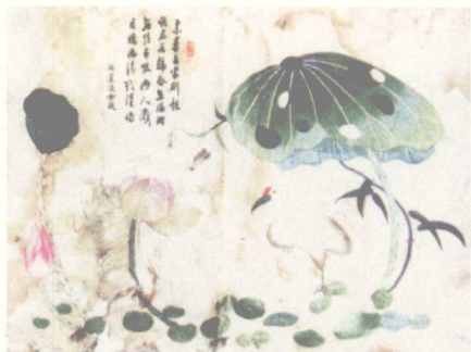
荷鹤图 曾寿山绘 胡莲仙刺绣 清末

嘉庆十五年(1810年)《长沙县志》卷十四“风俗”条载：“省会之区，妇女工刺绣者多，事纺绩者少。”又光绪三年(1877年)《善化县志》(含长沙市西南及望城县)卷十六“风俗”条载：“省会刺绣者多，乡村习纺绩者众。”这是长沙县现存方志中，两条内容相近而仅有的关于刺绣的记载。可知在1810年到1877年之间，湖南的刺绣原只限于自绣自用，以之美化生活环境。因此，在光绪三年(1877年)以前，湖南还没有“湘绣”这个专门的称谓。1877年到1887年间，湖南境内官员的服饰全由外省输入。太平天国农民起义被镇压后，清政府封赏了一大批湘军军官，这些新贵官员需用大量黼黻品级的刺绣品以装饰身份，于是，适应这种需求的绣庄便在长沙应运而生。最初，绣庄的业务专以运销苏绣、粤绣产品为主，而后，湘绣兴起，逐渐取代外省运入的绣品。据湖南近代著名社会史料汇集人徐崇之在《泸读羁居记》所述：“吾湘旧时绣店，亦题‘顾绣’，莫知所从来”；“上海顾绣始于顾氏，顾即顾名世之闺阁妇人，刺绣人物，气韵生动，字亦有法”；“长沙光绪末叶，湘绣盛行，超越苏绣，已不沿顾绣之名。法在改蓝本，染色丝，非复古步矣”；“绣像今复见之湘工，且流播海外，非顾氏所能及矣”。这说明，清光绪末年已首次较为完整地提出和记述了“湘绣”的概念及演变过程。