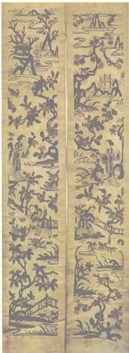
郊游图 挽袖 清末

吴县，很早就学会了刺绣，亦擅绘画。20岁时，她嫁与湖南湘阴人吴健生，婚后随夫回到湘阴。中年时，丈夫病逝，遗下四子一女，家中又无土地，生活一度极为困窘，她便尝试着以刺绣手艺来维持一家人的生活。最初，她将绣品托亲友带到长沙出售，但所托之人欺侮她没有人手，不是说亏损了路费，就是称绣品勉强叫人家受了，没有取回货款，肆意克扣代售绣品的钱资。为生活计，她没有因此放弃所擅长的刺绣劳作，反而精益求精，对刺绣的绣法、取材作了若干改进。