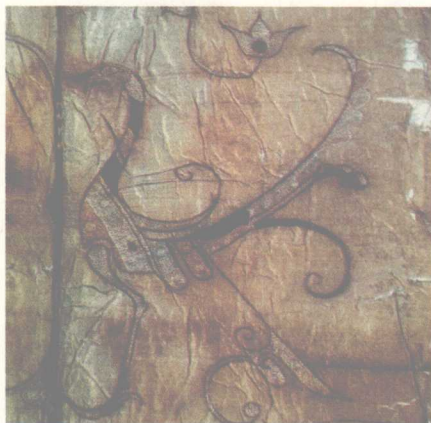
对龙对凤纹绣凤鸟纹 战国