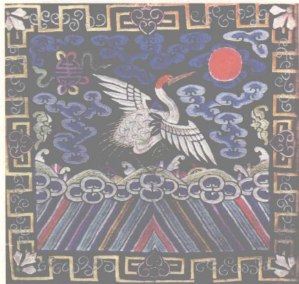
丹凤朝阴 黻黻（补子）清末