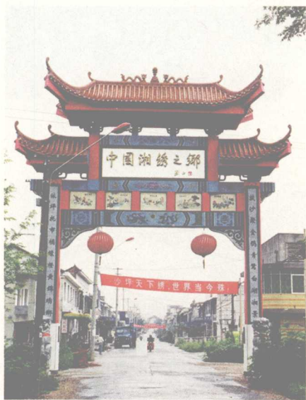
中国湘绣之乡——开福区沙坪镇牌坊

嘉庆十五年(1810年)《长沙县志》卷十四“风俗”条载：“省会之区，妇女工刺绣者多，事纺绩者少。”又光绪三年(1877年)《善化县志》(含长沙市西南及望城县)卷十六“风俗”条载：“省会刺绣者多，乡村习纺绩者众。”这是长沙县现存方志中，两条内容相近而仅有的关于刺绣的记载。可知在1810年到1877年之间，湖南的刺绣原只限于自绣自用，以之美化生活环境。因此，在光绪三年(1877年)以前，湖南还没有“湘绣”这个专门的称谓。1877年到1887年间，湖南境内官员的服饰全由外省输入。太平天国农民起义被镇压后，清政府封赏了一大批湘军军官，这些新贵官员需用大量黼黻品级的刺绣品以装饰身份，于是，适应这种需求的绣庄便在长沙应运而生。最初，绣庄的业务专以运销苏绣、粤绣产品为主，而后，湘绣兴起，逐渐取代外省运入的绣品。据湖南近代著名社会史料汇集人徐崇之在《泸读羁居记》所述：“吾湘旧时绣店，亦题‘顾绣’，莫知所从来”；“上海顾绣始于顾氏，顾即顾名世之闺阁妇人，刺绣人物，气韵生动，字亦有法”；“长沙光绪末叶，湘绣盛行，超越苏绣，已不沿顾绣之名。法在改蓝本，染色丝，非复古步矣”；“绣像今复见之湘工，且流播海外，非顾氏所能及矣”。这说明，清光绪末年已首次较为完整地提出和记述了“湘绣”的概念及演变过程。