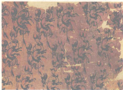
绢地茱萸纹绣 西汉