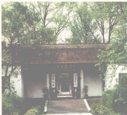
千年学府岳麓书院