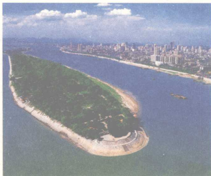
享有“山水洲城”美誉的长沙之一景： 橘子洲头

悠久的湖湘文化、神秘的伟人故里、秀美的山水洲城、人杰地灵的区域环境，是湘绣得以成形、兴盛繁荣的源泉。