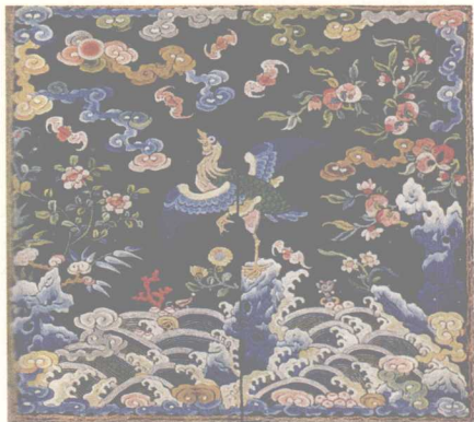
紫鹭鸶 黻黻（补子）清末