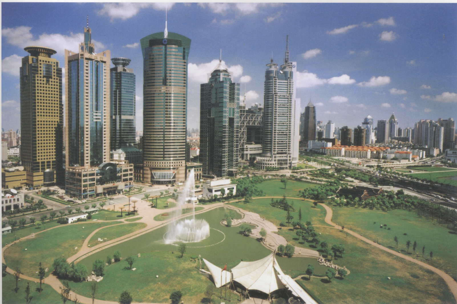
陆家嘴金融贸易区一角 Part of the Lujiazui Central Business District