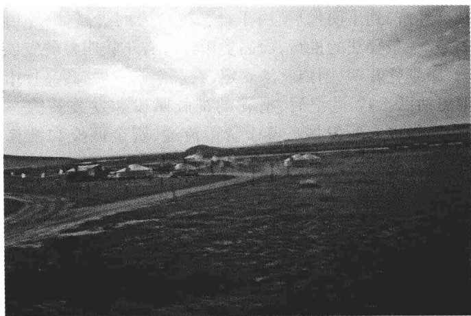
当年山西商帮经商地——内蒙呼伦贝尔草原蒙古包

历来在山西十分活跃。大量的考古文物表明,从汉代起,就有经蒙古草原通向中亚和北亚的两条商道:一是东起辽东,经燕山、阴山北麓,西奔戈壁、阿尔泰山,走天山北麓到中亚;二是经漠北高原、西伯利亚高原,到欧洲。有人称之为“草原丝绸之路”。自古以来山西商人在北方进行边境贸易,在南北农牧两大区域的物资交流