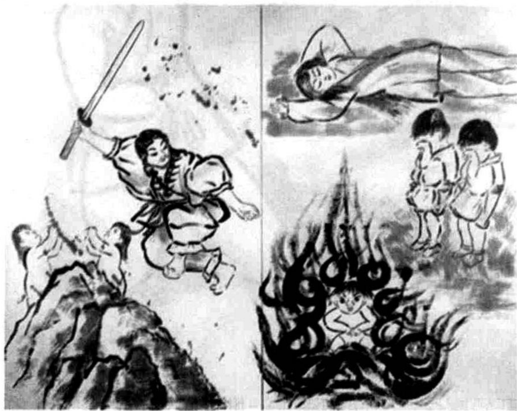
◎ 火神诞生与伊邪那美命死