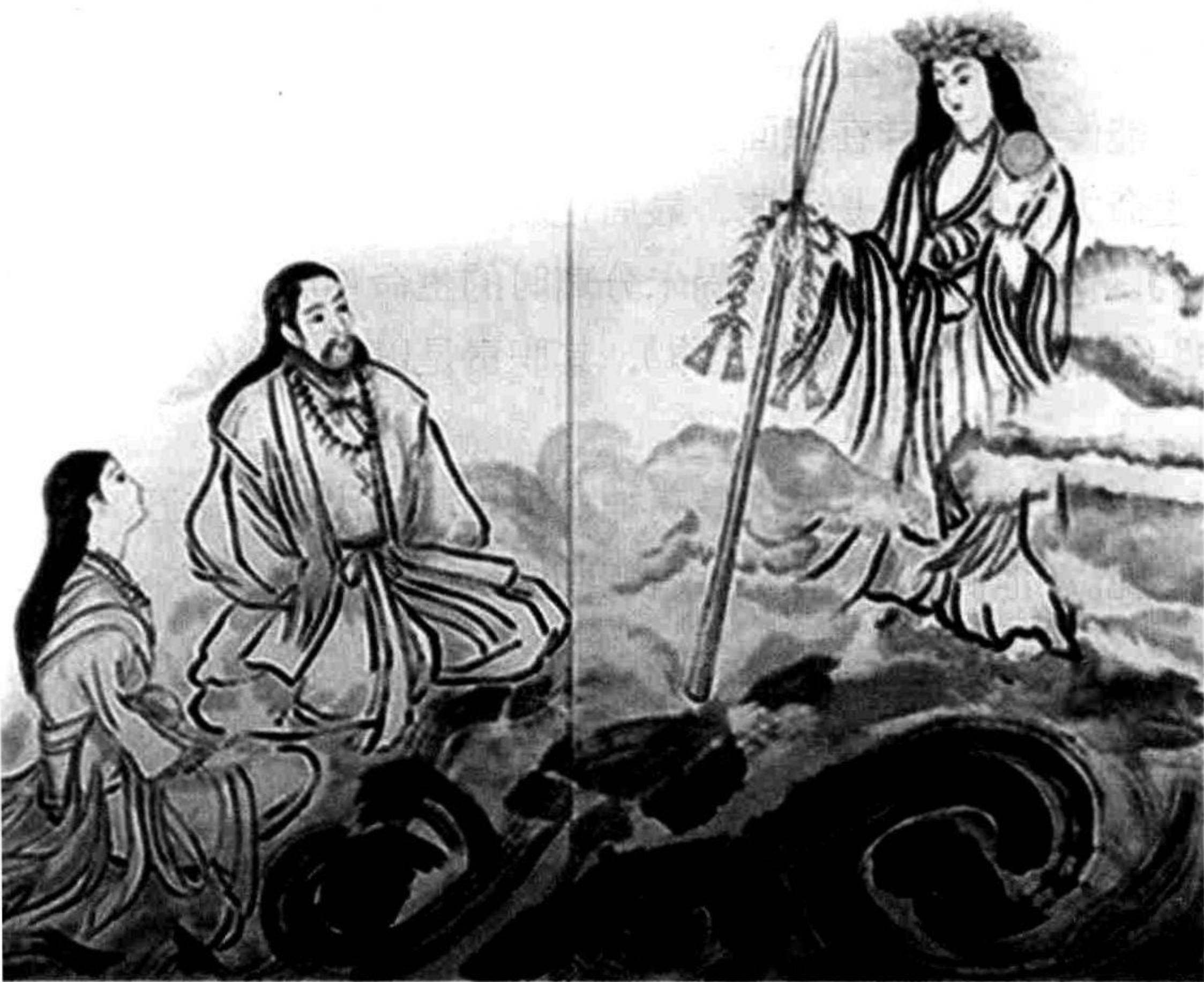
● 伊邪那岐命与伊邪那美命

二神遵命来到悬浮于天地之间的天浮桥上，俯视凡尘大地。透过翻飞的五彩祥云，看那大海蔚蓝，白浪如雪，天水相连，苍苍茫茫。遂将众神所赐予的天沼矛（《日本书纪》中称之为天之琼矛）