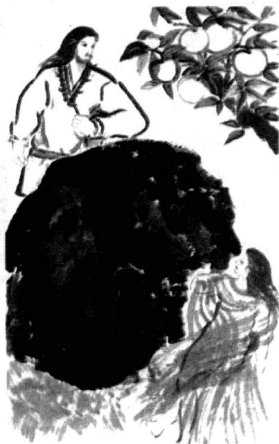
◎ 二神绝情黄泉比良坂

从此他们夫妻恩断义绝，而日本便每天必死千人，每天也必生一千五百人，人口以每日五百人的速度在增长。