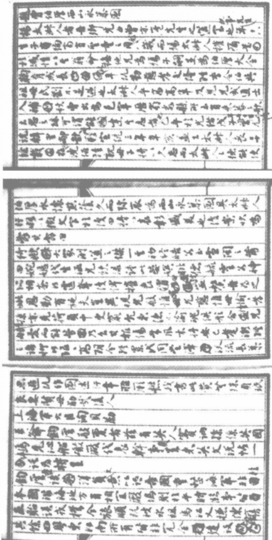
图片六： 題曾伯厚《西山永慕圖》