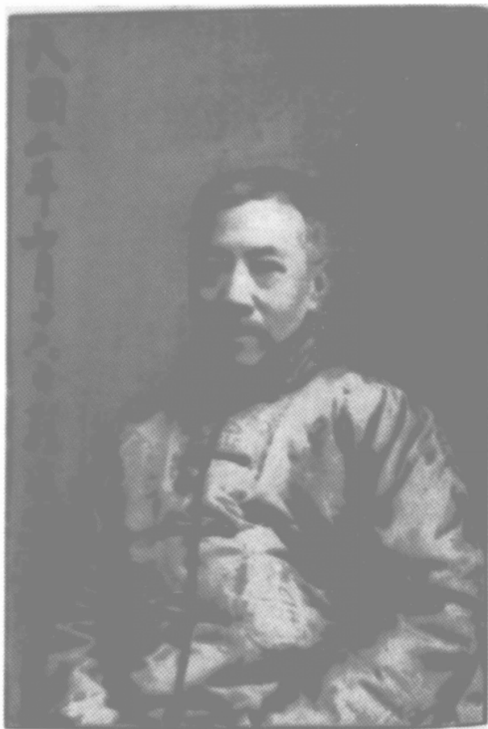
图片一：严复寄赠《宗圣杂志》社 1913 年留影