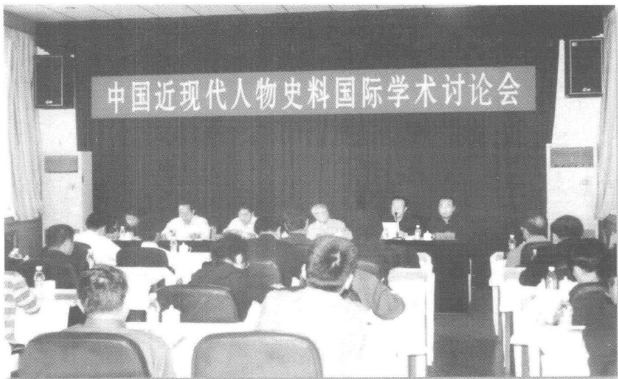
中国近现代人物史料国际学术讨论会开幕式