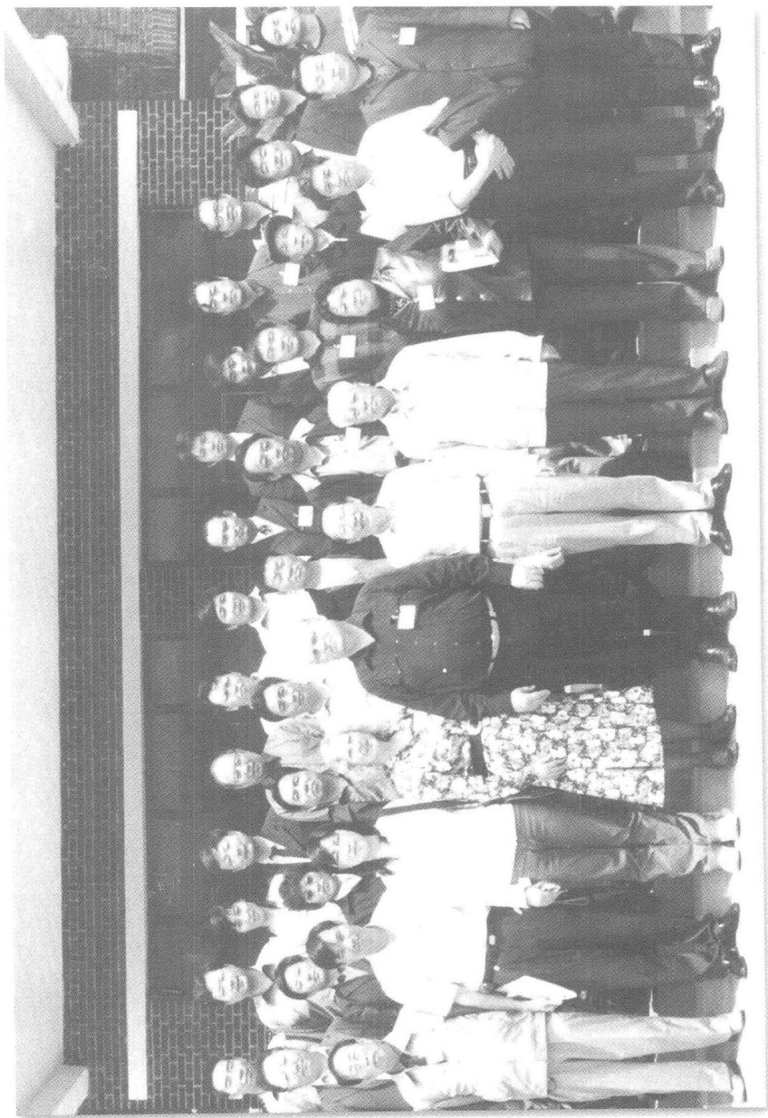
中国近代史国际学术讨论会与参会人员合影（2005年5月）