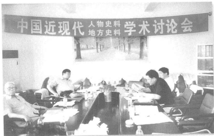
中国近现代人物史料地方史料学术讨论会会场（2006年6月）