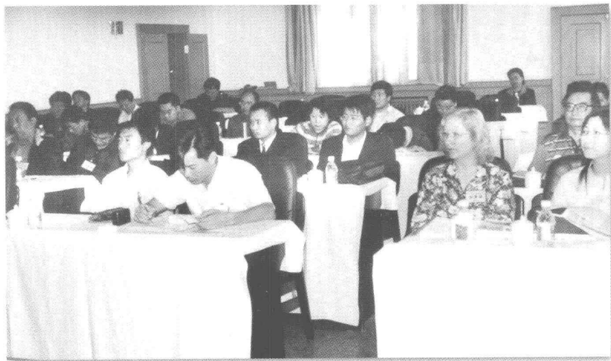
中国、美国、越南学者在讨论会会场