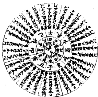
地私门阳贵人顺行图