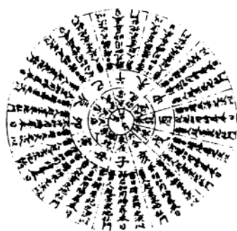
地私门阴贵人逆行图