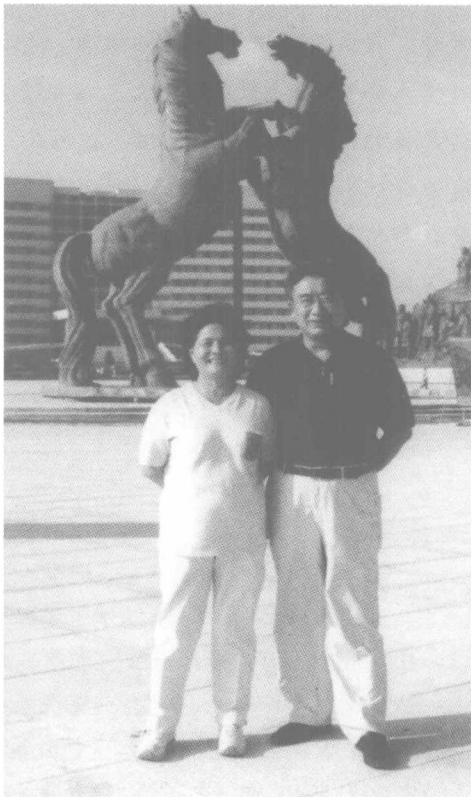
和夫人汤晓芳参观鄂尔多斯市康巴什新区 (2006年8月)