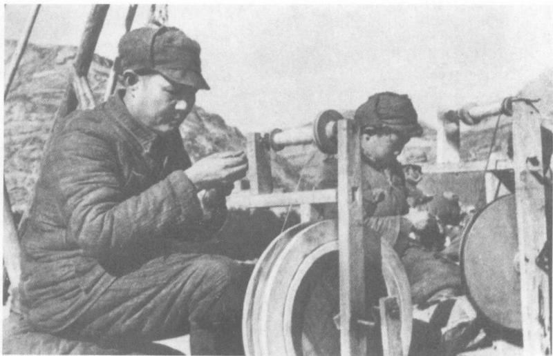
1943年叶剑英同志在延安大生产运动中纺线。