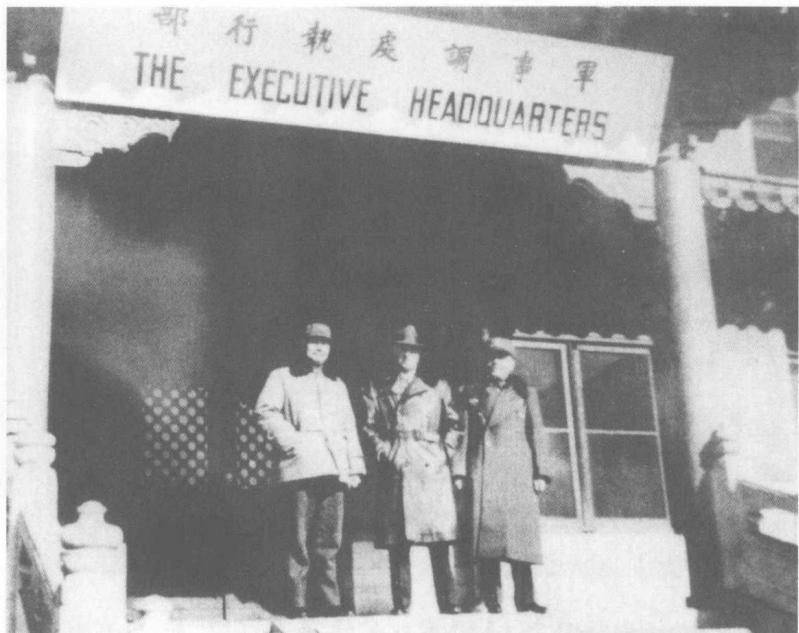
1946年，叶剑英同志与美国代表饶伯森（中）、国民党代表郑介民（右）在北平军事调处执行部。