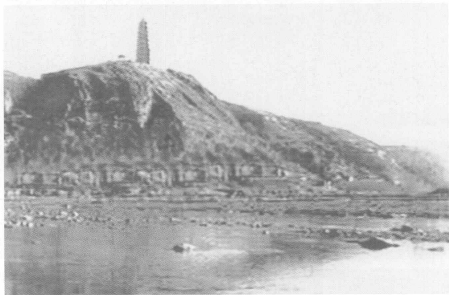
抗日战争时期的延安的宝塔山和延河水。