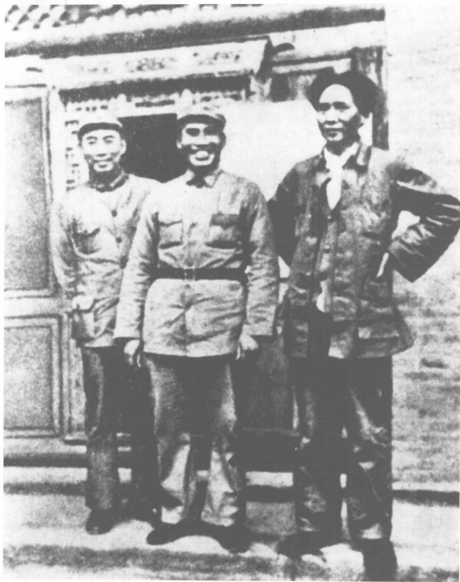
中央军委主席毛泽东（右）、副主席周恩来（左）、朱德（中）抗日战争初期在延安。