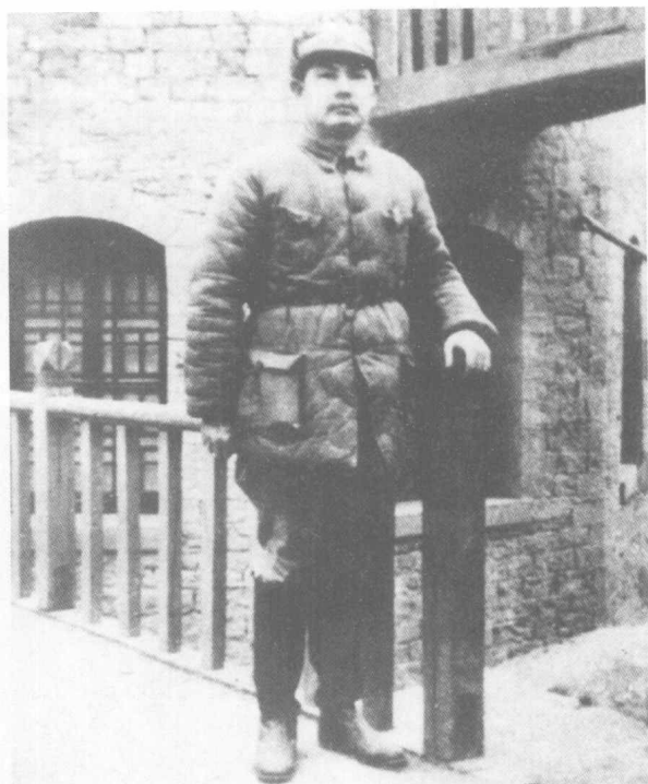
1941年叶剑英 参谋长在延安。