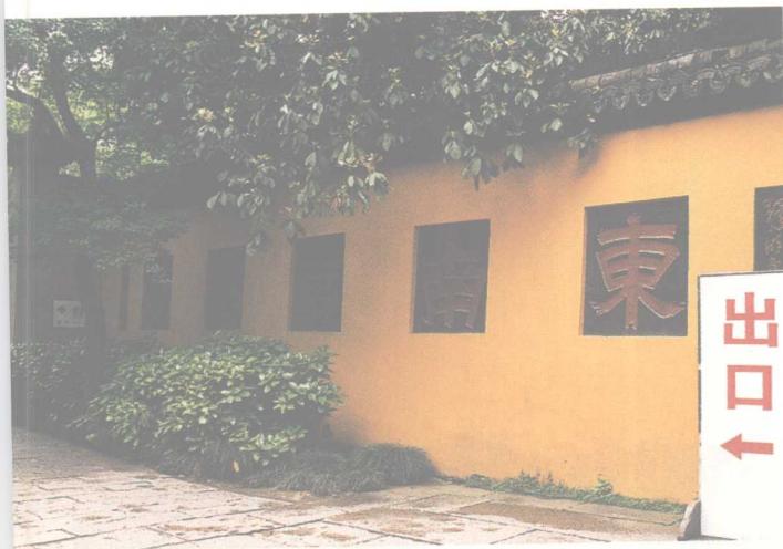
“东南第一山”/尽头小门外，是通往北高峰的路。