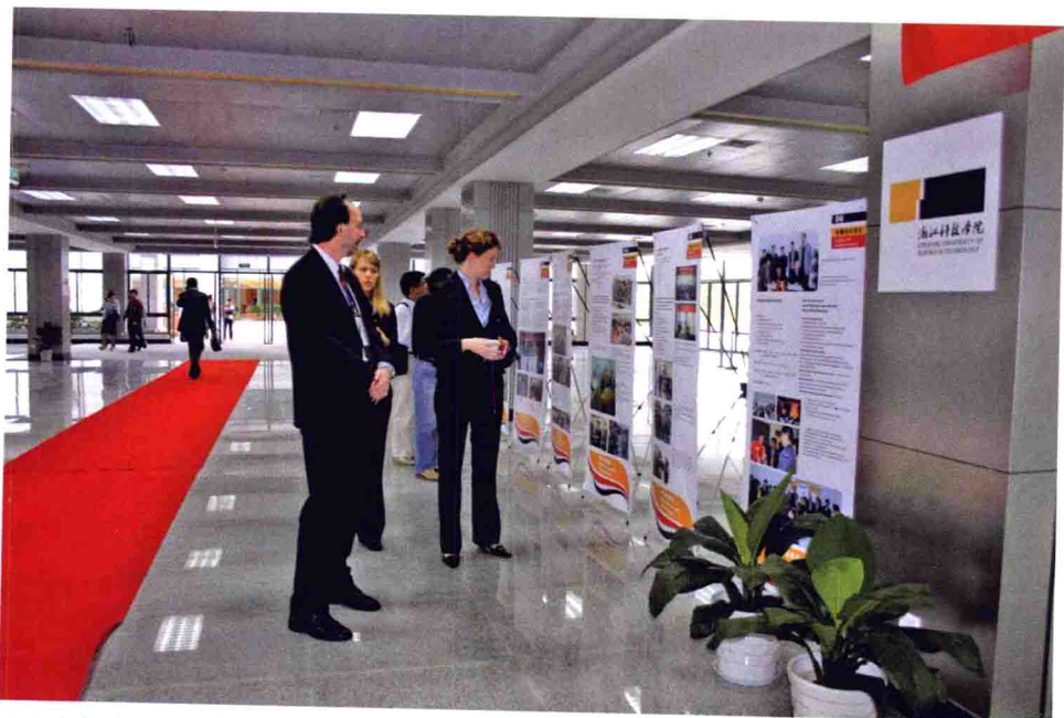
参加中德论坛的代表参观浙江科技学院中德合作成果展