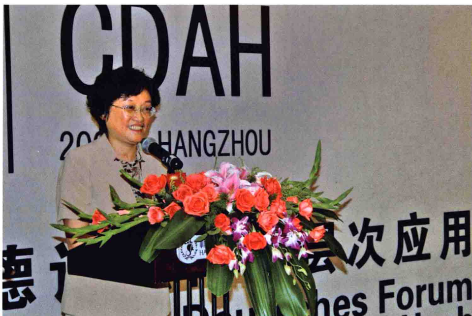
教育部副部长吴启迪作重要讲话