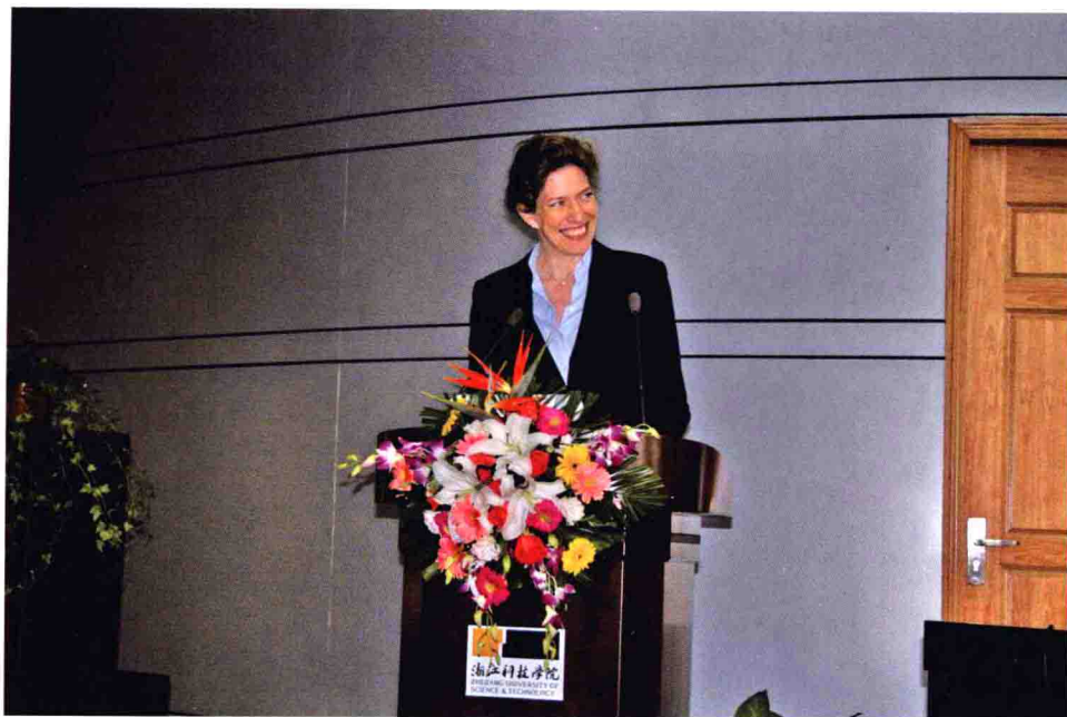
德国总领事馆文化领事舒艾沛致辞