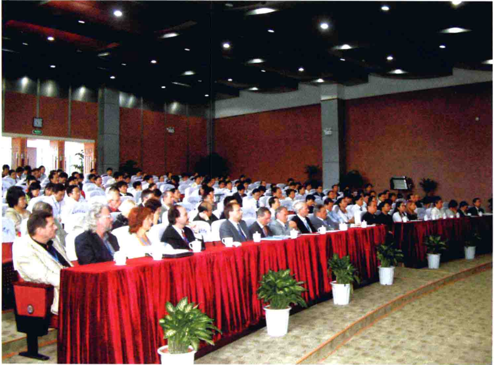
代表们聆听大会交流