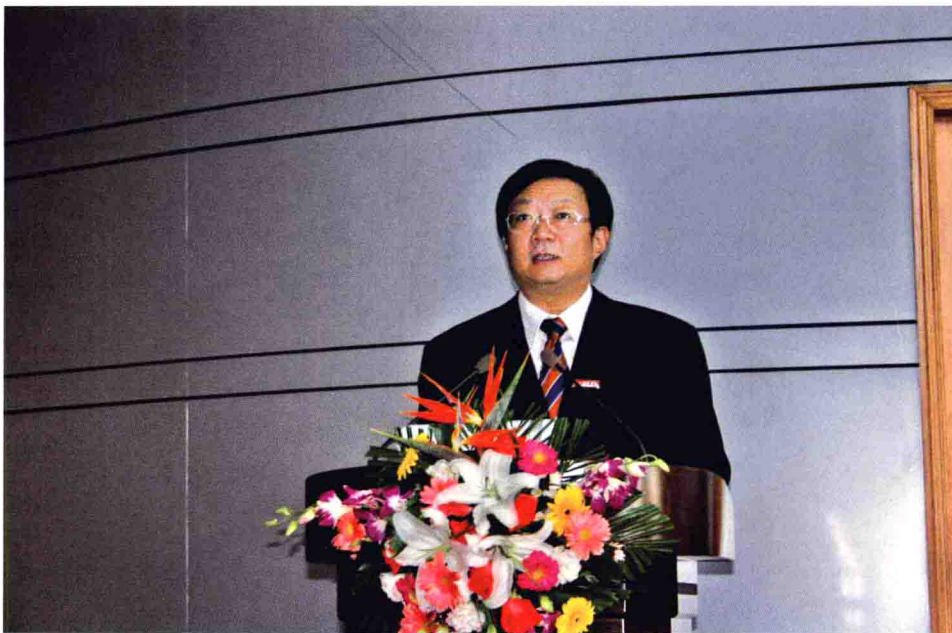
中德论坛组委会常务副主任、浙江科技学院院长杜卫在中德论坛上发言