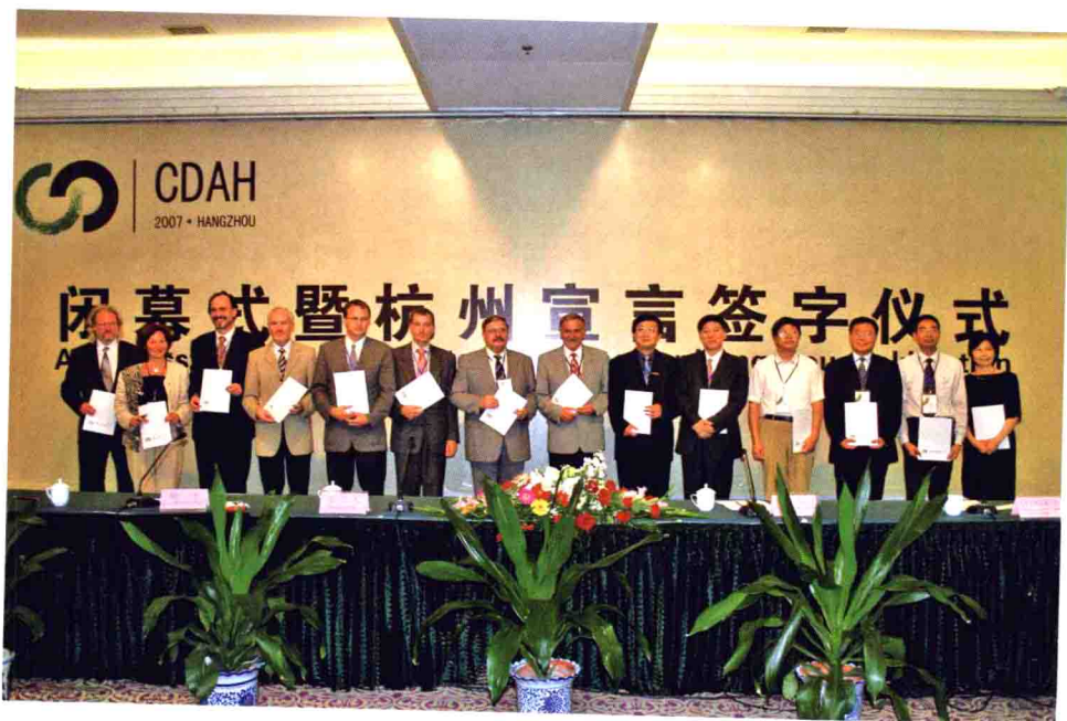
中德两国高校共同签署《杭州宣言》