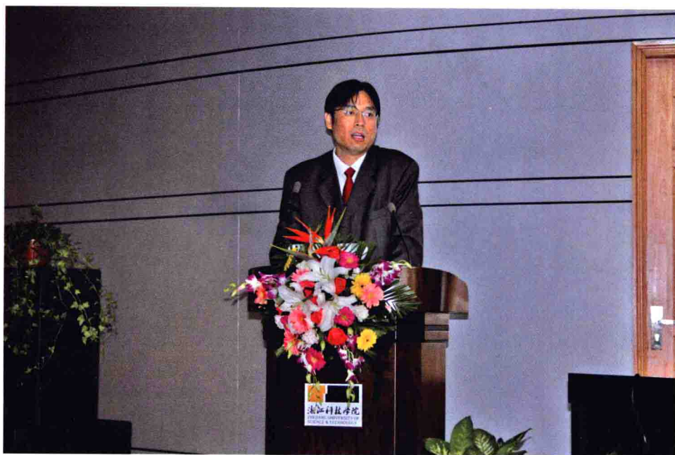
教育部国际合作与交流司副司长姜锋致辞