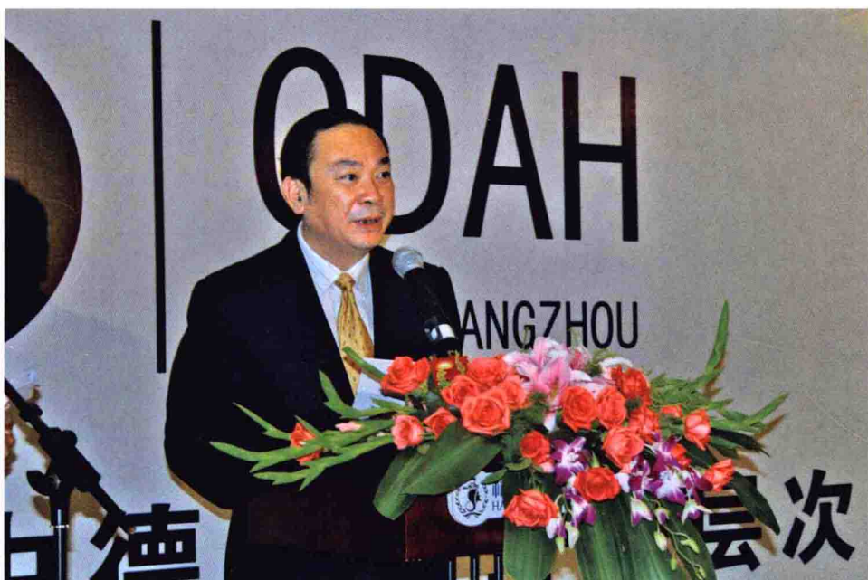
中共浙江省委常委、宣传部部长黄坤明致辞