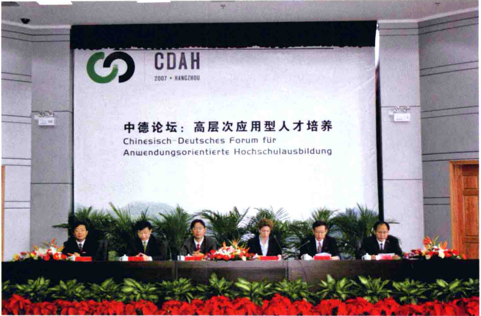
中德论坛大会交流