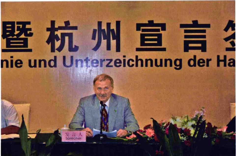
德国汉诺威应用科学大学副校长彼特·布鲁门多夫在中德论坛上发言