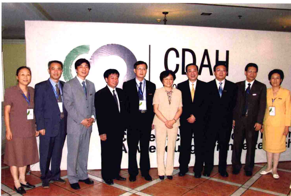
教育部副部长吴启迪，中共浙江省委常委、宣传部部长黄坤明与中德论坛承办单位浙江科技学院党政领导班子成员合影