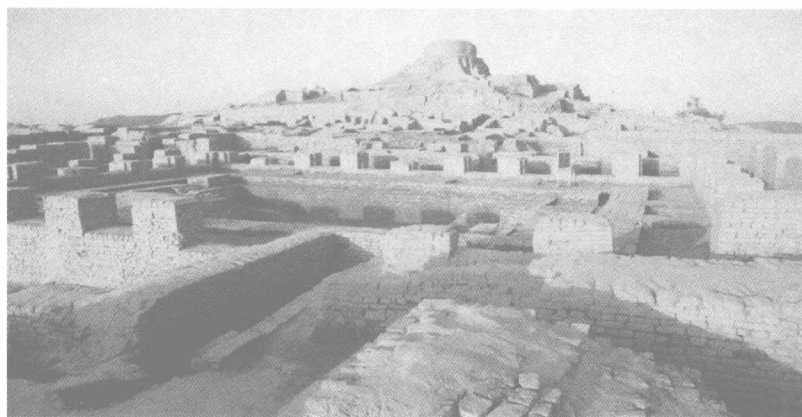
摩亨佐·达罗和哈拉本是哈拉本文明的两座典型城址，都已具备较大规模。此图为摩亨佐·达罗城遗址，位于巴基斯坦南部的信德省拉尔卡纳县，靠近印度河右岸。遗址有建筑在高地的庙宇、宫殿及储粮的仓库；低地则是市场与民居。