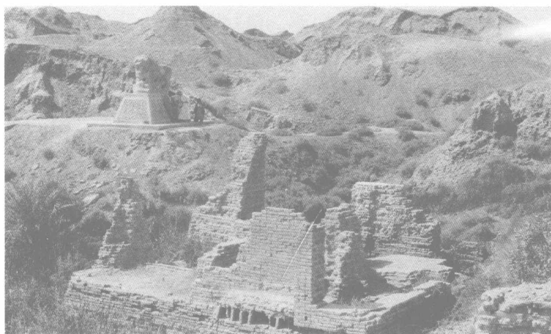
巴比伦遗址。巴比伦的宫殿与庙宇以砖瓦建成，经过风吹日晒，逐渐坍塌，终成瓦砾。此照片拍摄于20世纪30年代。