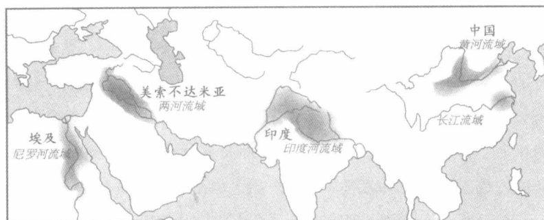
四大古文明位置图

洲大陆的若干印第安部落），其部落成年男子对于部落事务有相当的发言权，尤其在推选领袖时往往由成年战士们公决。希腊城邦中并非全是民主政体，雅典是最著名的民主城邦，斯巴达则是王政的城邦，而北边的马其顿是王国，不是城邦。