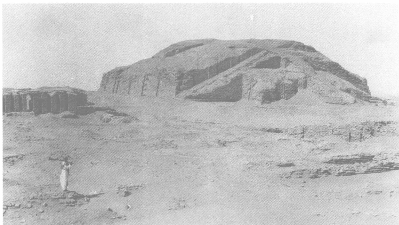
乌尔遗址，位于今伊拉克境内。此幅照片拍摄于1932年，画面中的巨大建筑是一座供奉月神的神庙。乌尔即《圣经》中的“吾珥”，是犹太人祖先亚伯拉罕的故乡。