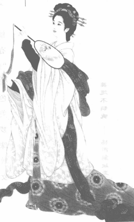
美不倾城，影不随人。